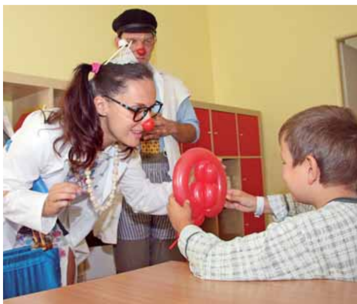
Dobrá nálada také léčí.

Úspěšnou akci zajišťuje nejen pro karlovarskou nemocnici, ale i pro dalších 54 nemocnic v Čechách a na Moravě občanské sdružení Zdravotní klaun. Ročně se díky tomu v karlovarské nemocnici zasmějí stovky pacientů, v celé republice pak více jak 70 000.