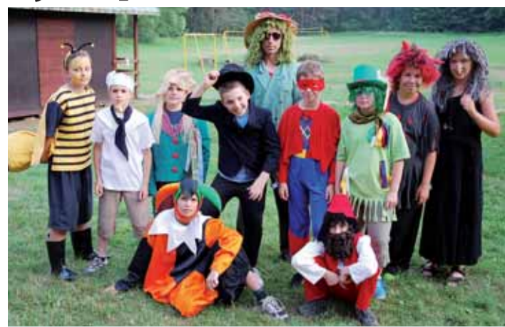
Tábor obývaly jen samé pohádkové bytosti.