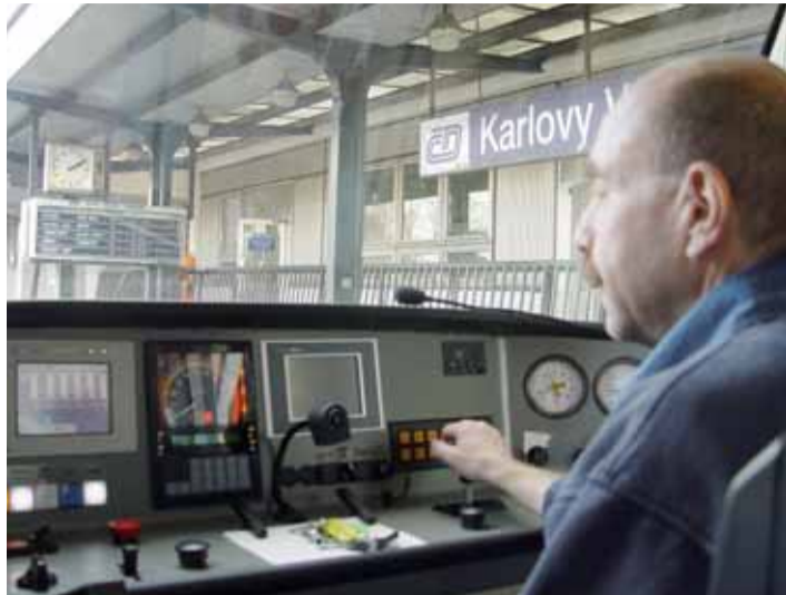
Vlaky budou spojoval obě karlovarská nádraží i nadále.

Kraj nyní připravuje návrh změn v jízdních řádech od jejich plánované