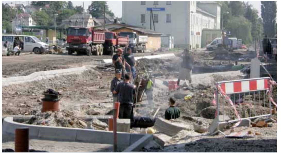
Stavba terminálu v Sokolově je už v plném proudu, příští rok může začít také v Chebu a M. Lázních.

Mariánské Lázně přijde na 75 milionů korun. Dojde k novému uspořádání autobusových zastávek, parkovacích stání, chodníků a ploch zeleně. Propojení mezi nádražní budovou a odjezdovými autobusovými stánkami - auto-