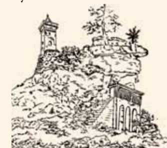
Goethova kresba Hradní věže na skále v Nejdku.

Putování po Goethových stopách pokračuje 27. 9. ve Svatošských skalách.