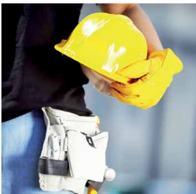
Výstavba nového křídla budovy gymnázia se uskuteční i díky evropské dotaci. Ilustrační foto

k demolici tzv. školičky, přičemž na jejím místě budou položeny základy pro nový objekt západního křídla, který zde v brzké době vyroste. Na další letní prázdniny pak máme naplánovanou rekonstrukci šaten v hlavní budově školy a bezbariérové úpravy. Předpokládáme, že projekt bude dokončen v listopadu příštího roku,“ doplnil ředitel gymnázia Zdeněk Papež.