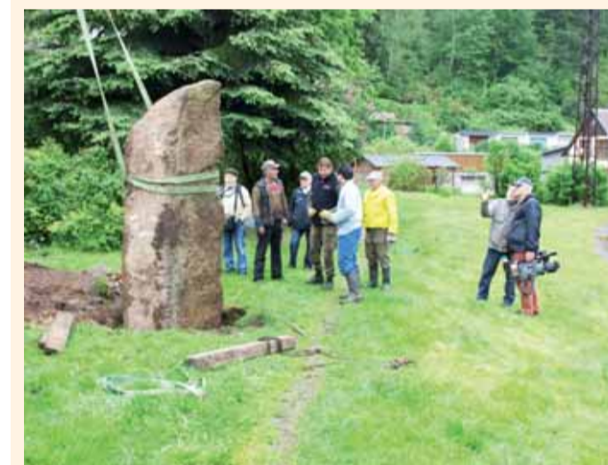
Usazování monolitu, na kterém bude umístěna pamětní deska.

Tady všude byl... Kdo? Johann Wolfgang Goethe. Po jeho stopách se vydali karlovarští rotariáni, za podpory Karlovarského kraje a města Nejdek, s občanským sdružením JoN – Jde o Nejde a obce Andělská Hora s jejím občanským sdružením.