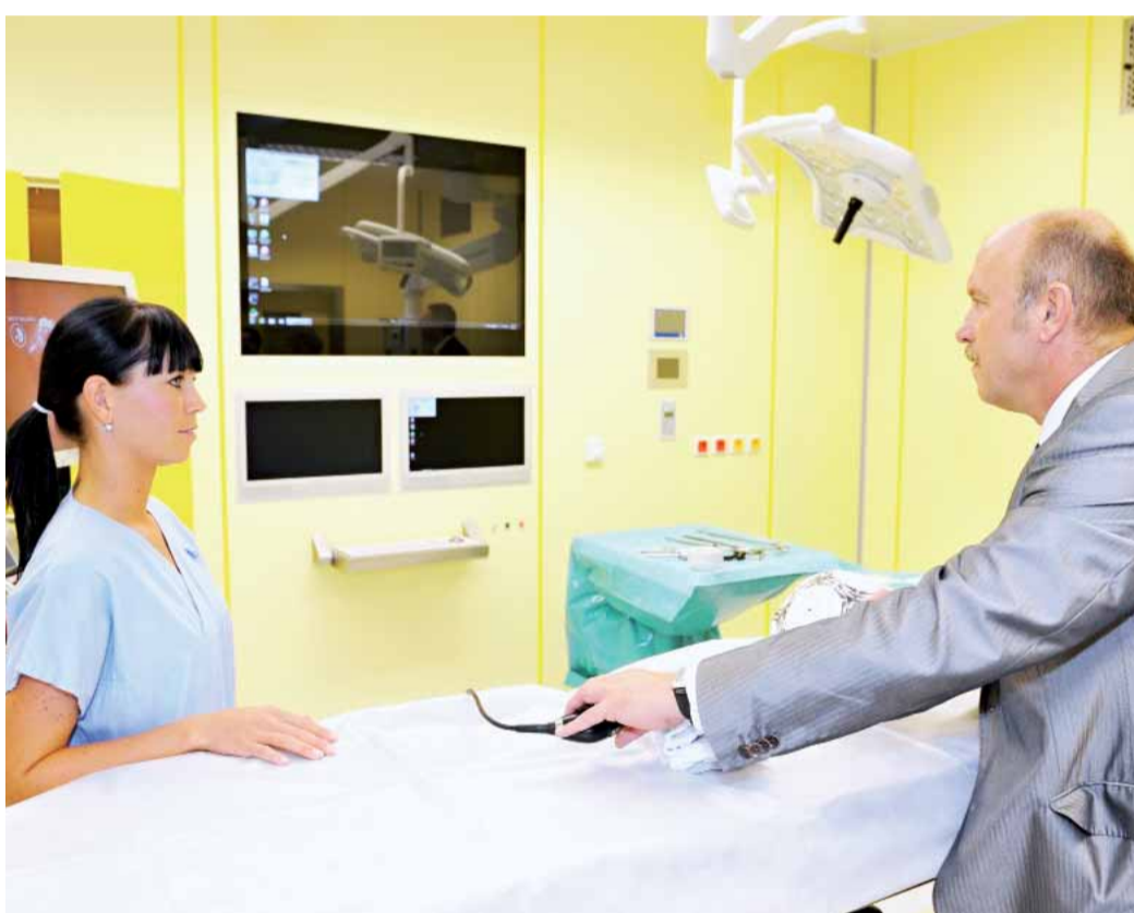
Nové přístroje v karlovarské nemocnici představují pro pacienty větší komfort.