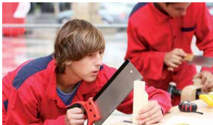
Ložští účastníci soutěže Machři roku.

Studenti učňovských oborů z celé ČR se už brzy začnou balit na cestu do Sokolova. V průmyslovém městě na Ohři se utkají o titul Machři roku 2014, a to v oborech mechanik, elektrikář, instalatér a truhlář. Soutěž budoucích řemeslníků se v Karlovarském kraji uskuteční vůbec poprvé, a to 23. září.