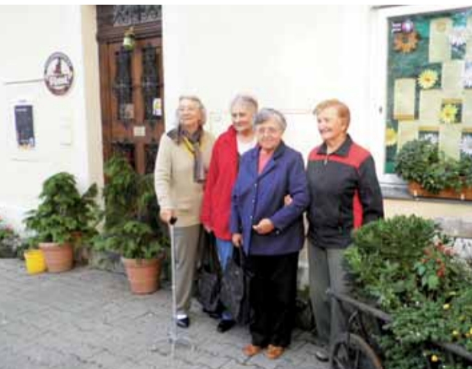
Klienti jsou podle svých slov spokojeni především s odborným personálem a chválí si též individuální přístup k nim samotným.

„Jsme certifikované pracoviště České alzheimerovské společnosti,“ upozorňuje. Farní charita ale poskytuje služby také lidem s onemocněním pohybového a nosného aparátu, se smyslovým postižením, s kardiovaskulárními chorobami a s poruchou metabolismu. „Základní ideou je, aby si klient