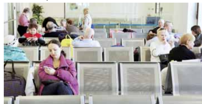
Letiště v Karlových Varech zaznamenalo meziroční pokles cestujících o 16,7 procenta.

Společnosti Letiště Karlovy Vary, která provozuje karlovarské letiště, poklesl počet odbavených cestujících v prvním pololetí roku 2014 o 16,7 procenta ve srovnání se stejným obdobím roku předchozího. Je to první propad cestujících za několik posledních let.