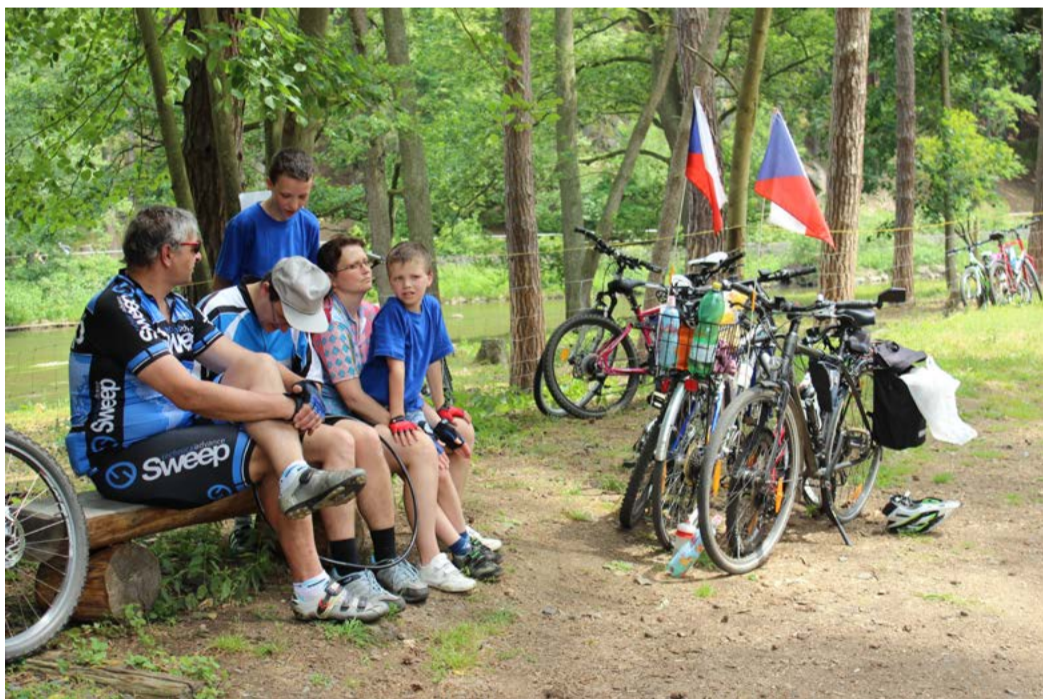
Pod Svatošské skály dorazili cyklisté všech věkových kategorií.