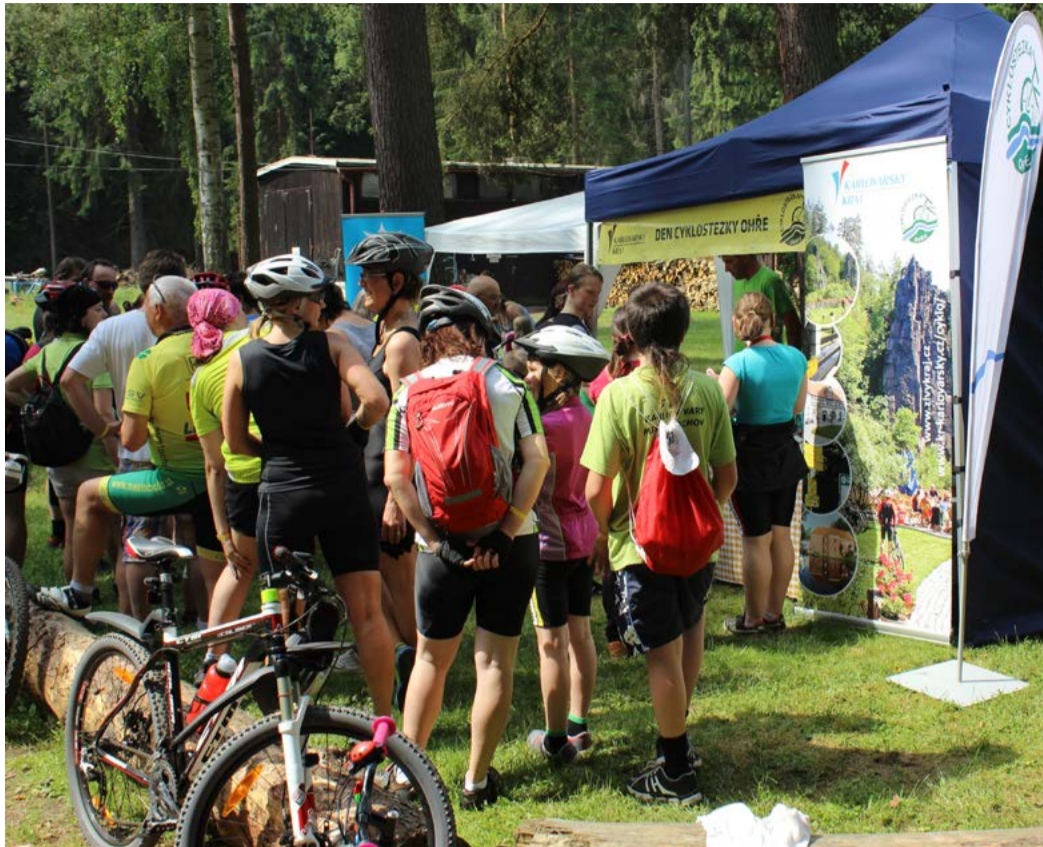
O informační stan, kde si účastníci Dne Cyklostezky Ohře mohli vyzvednout dárky, byl velký zájem.