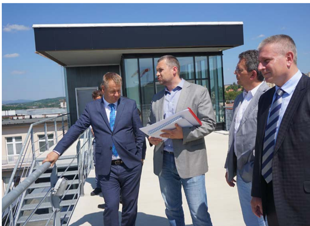
Ministr zdravotnictví Svatoopluk Němeček si prohlédl heliport karlovarské nemocnice.