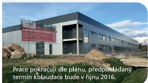
Práce pokračují dle plánu, předpokládáný termín kolaudace bude v říjnu 2016.

Není divu, že společnost ept connector s.r.o. v současnosti patří mezi nejvýznamnější strojírenské společnosti v sokolovském regionu.