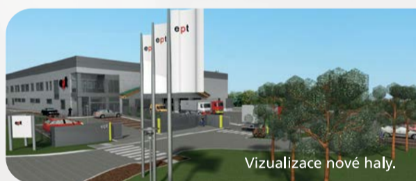
Vizualizace nové haly.