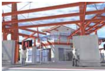
Plánované podoby dopravních terminálů v Chebu a M. Lázních, vpravo stavba v Sokolově koncem zimy.

Hlavní část díla za 110 milionů korun ale probíhá podle původního plánu. Rekonstruovaná Nádražní ulice a nové parkoviště již slouží, na novém autobusovém nádraží probíhá instalace osvětlení a stanovišť autobusů.