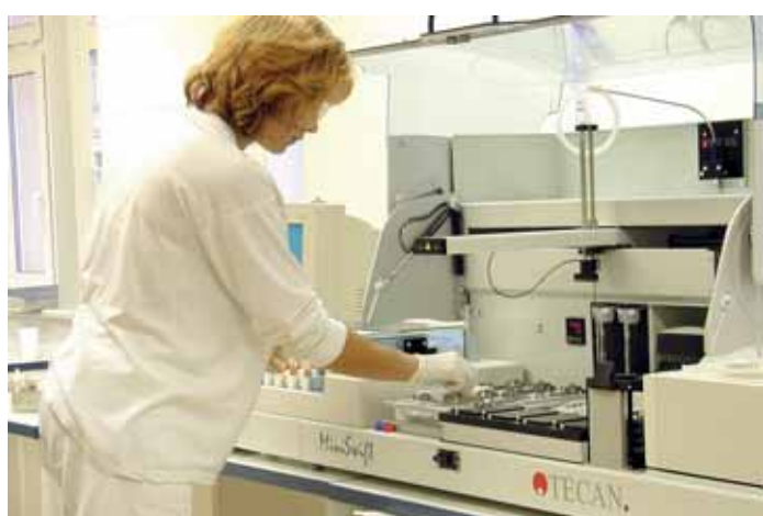
Nové vybavení transfúzní stanice