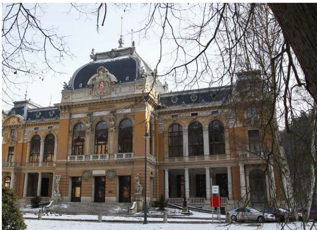
Obnova Císařských lázní Dosud nikomu se nepodařilo dotáhnout rekonstrukci památky až do konce.

„Karlovarský kraj garantuje to, k čemu se v minulosti zavázal, tedy řádně opravit tuto památku, která je perlou našeho regionu. Na druhou stranu musím konstatovat, že se do dnešního dne obnovu Císařských lázní nikomu nepodařilo dotáhnout do konce a památku zrekonstruovat. Pokud přejdou závazky zájmového sdružení na Karlovarský kraj, jsme připraveni budovu opravit. Chceme ale transparentní výběrové řízení s jasně krytým financováním. Otevřeme také veřejnou diskusi o projektu, týkající se především dispozičního uspořádání. A v neposlední řadě kraj vynaloží veškeré úsilí, abychom získali dotace z evropských fondů na celou stavbu, což by významně uspořilo peníze z kraj-