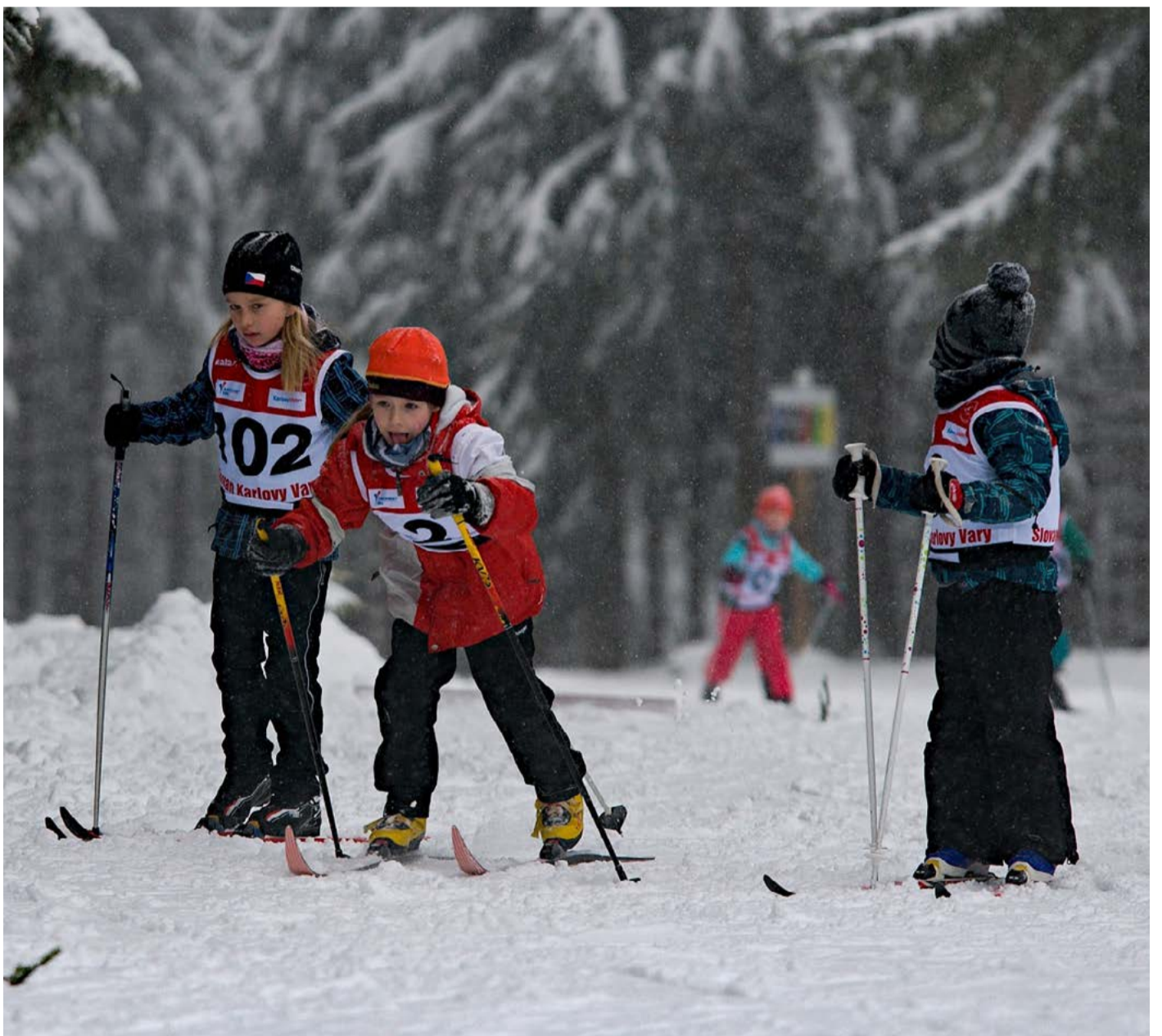
Štít Krušných hor Tradiční je pro závod termín o prvním lednovém víkendu, místo závodů na Jahodové louce v areálu v bezprostřední blízkosti Božího Daru i hojná účast lyžařů. Od velkých až po ty nejmenší.

Návštěvníci Krušných hor by neměli vynechat ani závody a akce pro veřejnost, které nabídnou nevšední zimní podívanou. Jejich výčet najdete na internetových stránkách obecně prospěšné společnosti. Pokud se rozhodnete vyrazit za zimními radovánkami do Krušných hor, nezapomeňte navštívit turistický portál Živý kraj, kde naleznete veškeré potřebné informace, včetně nabídek ubytování, stavování a dopravy. (KÚ)