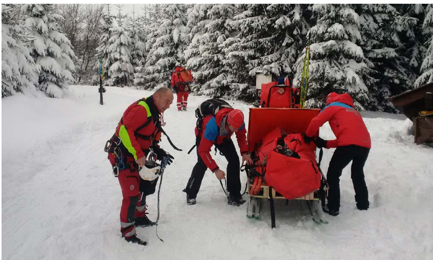
Zásah HS Během prvního lednového víkendu zasahovala horská služba v Krušných horách celkem jedenáctičetkrát.

A která to jsou? Především platí, jako i jindy v životě: berte ohledy na ostatní. Neohrožujte nebo nepoškozujte někoho jiného. Mějte pod kontrolou rychlost a způsob jízdy. Předjíždět se může ze shora nebo zespoda, zprava nebo zleva, ale vždy jen s odstupem. Pokud chcete vjet do sjezdové tratě nebo se chcete po zastavení opět rozjet, musíte se rozhlédnout nahoru a dolů a přesvědčit se, že to můžete učinit bez nebezpečí pro sebe a pro ostatní. Jako na silnici. Zbytečně se nezdr-