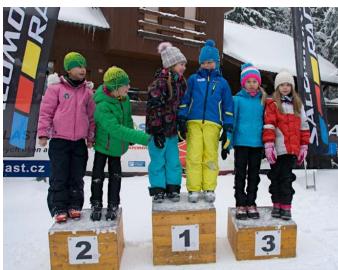
Na Jahodové louce Tři závody uspořádali běžci na lyžích ze Slovanu Karlovy Vary v rozmezí čtrnácti dní na přelomu roku, posledním z nich byl tradiční Štít Krušných hor.

V neděli se jel závod v rámci Memoriálu Jaroslava Mašaty jako „Americké štafety“ dvojic v kombinaci s přezouvačkou. „Jde o závod, kdy se jede kombinace klasické a volné techniky. Dva závodníci se střídají a postupně odjedou jak klasický, tak bruslicí okruh,“ vysvětluje Jitka Peřina novinku, která se jela o víkendu od staršího žactva výše. Závodníci Slovanu znovu dosáhli několikrát na nejlepší místa: sedm-