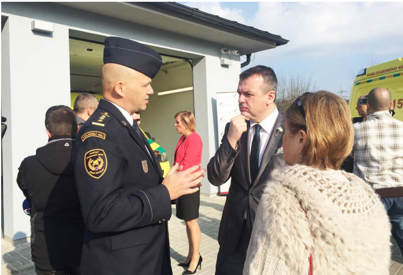
U záchranářů v Ostrově Náměstek ředitele Hasičského záchraného sboru ČR Oldřich Volf (vlevo) diskutuje s krajským radním pro zdravotnictví Janem Burešem a předsedkyní výboru pro zdravotnictví při krajském zastupitelstvu Věrou Procházkovou.

Město Ostrov v budoucnu chystá další rozvoj areálu, kde by měli sídlit kromě záchranářů také hasiči a městská policie. (KÚ)