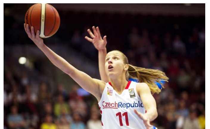
MEZINÁRODNÍ TURNAJ ŽEN V KARLOVÝCH VARECH Evropský šampionát budou od 16. do 25. června hostit Praha a Hradec Králové. Na turnaji na západě Čech si české basketbalistky poprvé vyzkouší svou aktuální formu po dvou týdnech regenerace, kondiční a basketbalové přípravy.