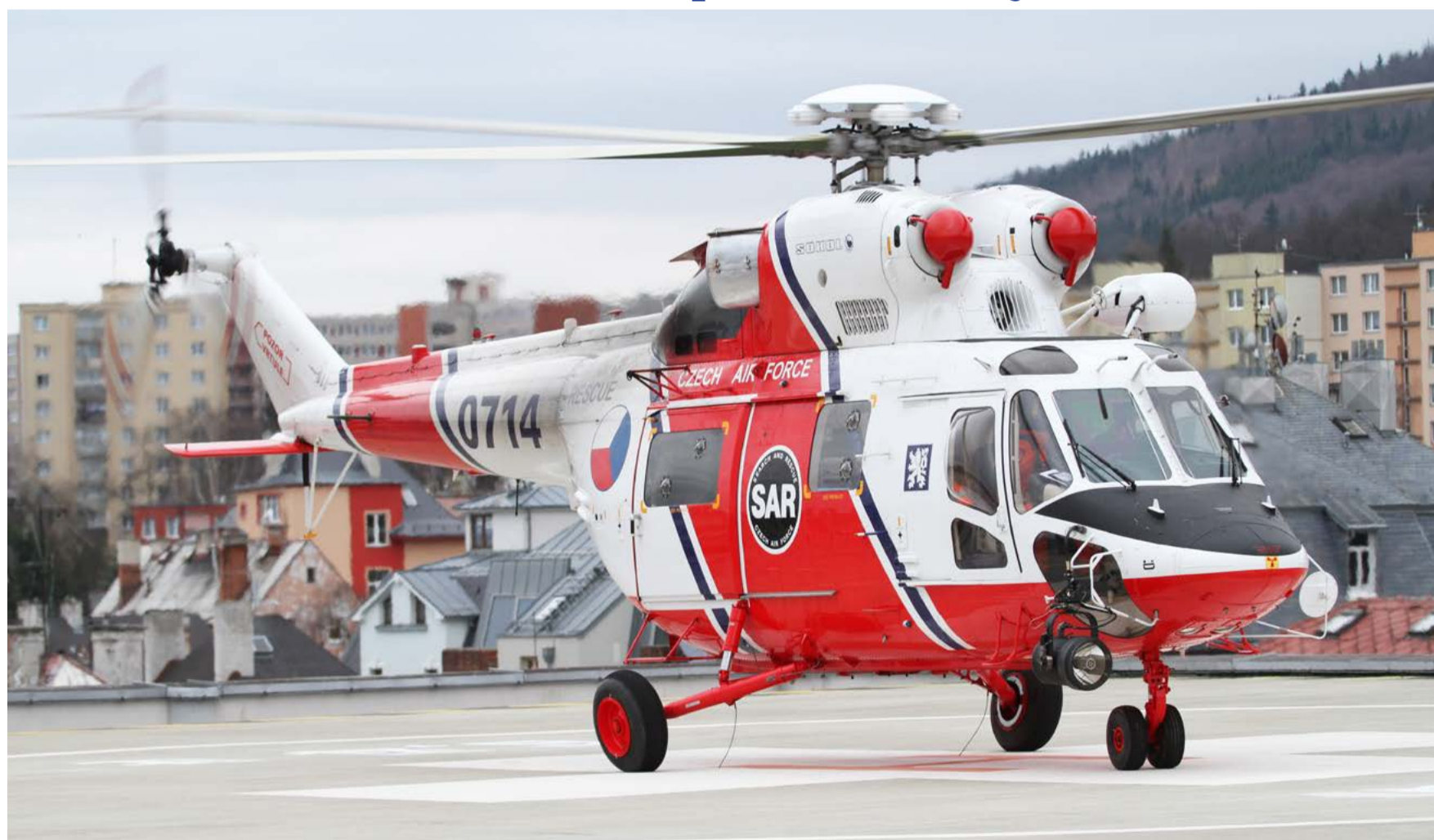
Vrtulník PZL W-3 Sokół provozovaný Leteckou záchrannou službou Armády ČR Plzeň – Líně na střeše karlovarské nemocnice.