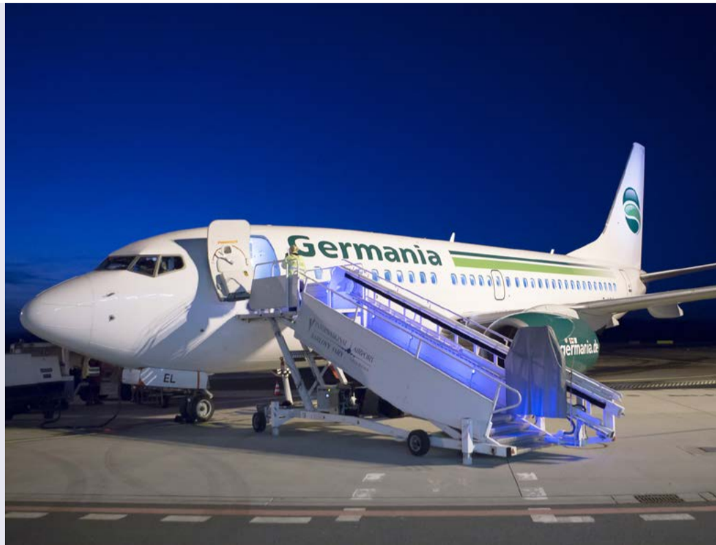
Karlovy Vary - Düsseldorf Letadlo Boeing 737-700 společnosti Germania přistálo na karlovarském letišti poprvé koncem března.

Let ST8421 odletá z KLV ve 2110 a přilétá do DUS ve 2220