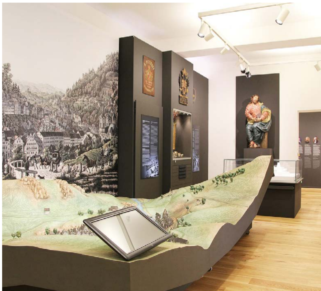
Stálá expozice U příležitosti 150 let své existence získala expozice v Muzeu Karlovy Vary na Nové louce zcela novou podobu.

kteří ještě nikdy nebyly veřejnosti prezentovány, či exponáty, které byly vytvořeny speciálně pro novou expozici. Mezi nimi například faksimile zakládací listiny Karlových Varů - privilegium Karla IV. ze 14. srpna 1370, respektive její tereziánský opis z roku 1747, protože originál se nedochoval. Vedle množství interaktivních prvků doplňuje expozici i Haptická nebo-li dotyková stezka s heslem „exponátů dotýkat se povoleno“ a Dětská stezka, kterou si musí malí návštěvníci v každém sále najít. Muzeum se změnilo stavebně - vstupní vestibul je mnohem přívětivější než býval, návštěvníkům s omezenou pohyblivostí je k dispozici výtah, projekt pamatoval i na konferenční místnost, samoobslužnou šatnu a odpočinkovou zónu. Součástí sálů pro krátkodobé výstavy v přízemí bude i přilehlé nádvoří, které zejména v létě bude sloužit pro vystavení uměleckých solitérů. Nádvoří bude rovněž sloužit jako oddechová zóna pro veřejnost. Celou akci financoval Karlovarský kraj. (KÚ)