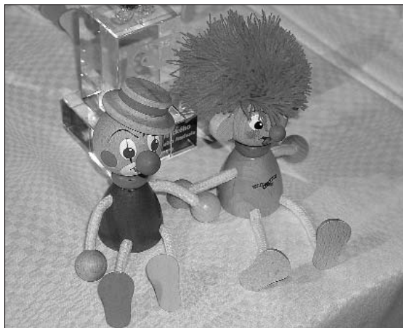
Ceny pro vítěze festivalu.

Soutěžní projekce navštívilo v Ostrově téměř 4000 diváků, v satelitních městech 3000 dětí. Pět veřejných projekcí soutěžních filmů vidělo přes 1100 diváků, na čtrnáct promítaných pohádek se přišlo podívat 1200 dětí.