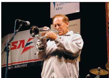
Jedním z hostů festivalu Jazz Jam Cheb 2003 byl Laco Deczi. Karlovarský kraj podpořil festival částkou 50 000 Kč.