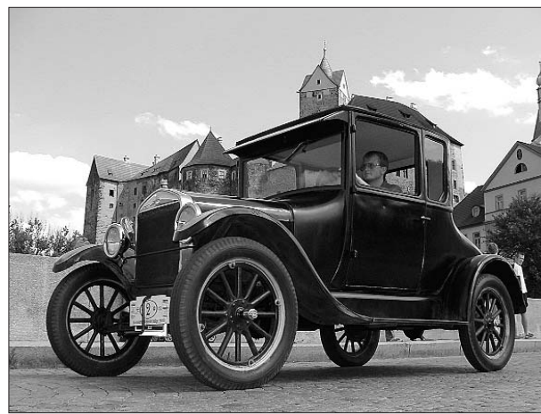
Dobře opravenou silnici ocení řidič každého vozu

„V této chvíli jsme museli technické možnosti krajské správy a údržby silnic pro zpracování podmínek veřejné obchodní soutěže posílit výběrem zpracovatele, který má s rekonstrukcemi a opravami souvislých úseků silnic zkušenosti. S ohledem na zákon o zadávání veřejných zakázek bychom mohli tuto akci zadat z volné ruky, ale přesto požádáme víc zájemců. Jedním z nich samozřejmě bude ředitelství silnic a dálnic, které na území naší republiky má v této oblasti největší