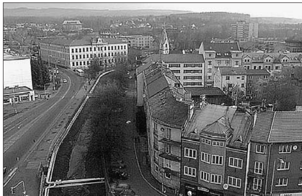
Centrum Sokolova z ptáčích perspektivy.