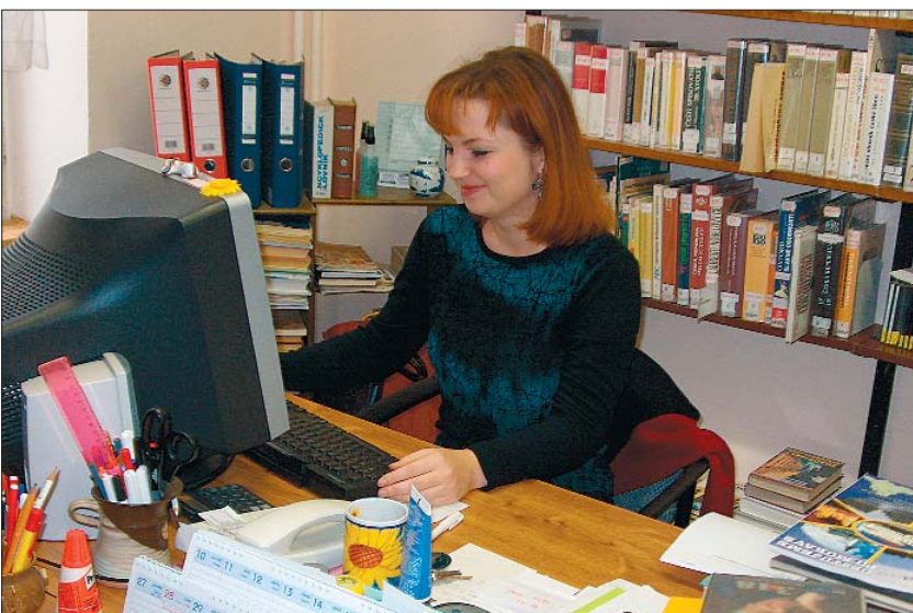
Takto vypadá místo, kde pracovnice knihovny každý den připravují monitoring tisku pro Krajský úřad Karlovarského kraje.