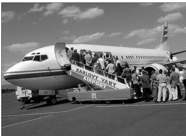
Letiště by měl stát převést na Karlovarský kraj 1. 1. 2004.

Nyní záleží na tom, jaká metodika oceňování letišť bude zvolena.