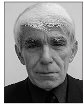
Ing. Jan Zborník, první náměstek hejtmána (ODS)

Karlovarský kraj připravuje souvislou opravu 200 kilometrů dopravně nejvytíženějších silnic II. a III. třídy, které na něj převedl stát. Finančně nesmírně náročnou akci v řádu stamilionů korun nelze provést najednou, proto budou opravy již přesně určených úseků silnic probíhat postupně.