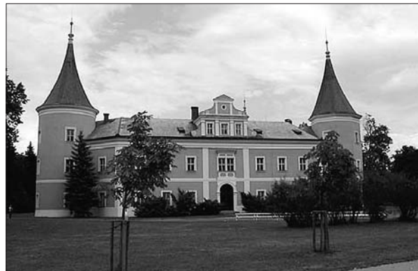
Sokolovský zámek je sídlem muzea.

tů a do té doby nabízíme místa na vyučování v Domě kultury. Snažíme se všechny formy školství podporovat, protože vzdělanostní úroveň obyvatelstva je nejnižší v České republice, a to chceme změnit,“ říká starosta. Podle něj v budoucnosti ubude pracovních míst, kde není potřeba kvalifikovaná síla, protože za 25 let ukončí provoz největší zaměstnavatel v regionu, akciová společnost Sokolovská uhelná. S uplatněním obyvatel na trhu práce by pak byl problém.