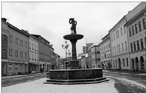
Kašna se sokolníkem na Starém náměstí.

„Přislíbili jsme finanční příspěvek pro přestavbu školních objek-