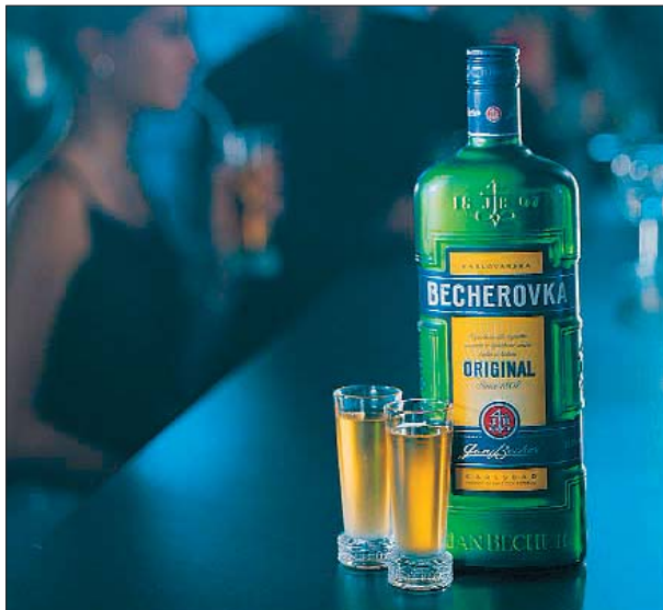
Takto vypadá Becherovka v „nových šatech“

Firma Jan Becher - Karlovarská Becherovka, a. s. (JAN BECHER) patří mezi významné podniky regionu - a to nejen díky své téměř dvousetleté historii, s Karlovarským krajem úzce spojené, nýbrž i z ekonomického hlediska.