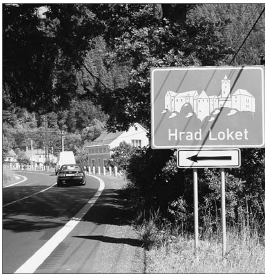
Informační tabule upozorňují návštěvníky kraje nejen na významné památky, ale ukazují jim i cestu do historických center měst a obcí.

Kraj se snaží těžit i z velké koncentrace lázní na svém území, která napomáhá rozvoji ozdravného turistického ruchu. Léčební přírodní metodami je velmi populární a kraj se snaží tohoto trendu využít například při prezentaci na veletrzích cestovního ruchu. Kvalitní zážemí a zkušenosti balneologických lékařů využívá stále více lidí z České republiky i zahraničí. To podle náměstka Behenského oceňují nejen návštěvníci lázní, ale také místní podnikatelé.