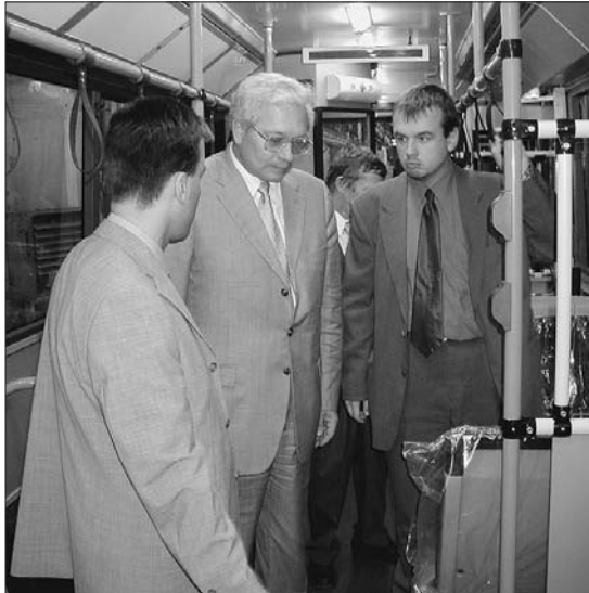
Při návštěvě Škody Ostrov si hejtmán prohlédl výrobní halu na trolejbusy.