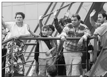
Ilustrační foto Internet

„Rada z nich navíc směřovala právě na kulturně-společenské akce, takže jsme jim nemohli vyho-