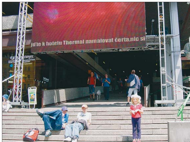
Děti, dospělí, turisté i místní obyvatelé se bavili při sledování nepřeberného množství filmů na letošním MFF Karlovy Vary 2003. Fotoreportáž a další informace o této události najdete na straně 8.