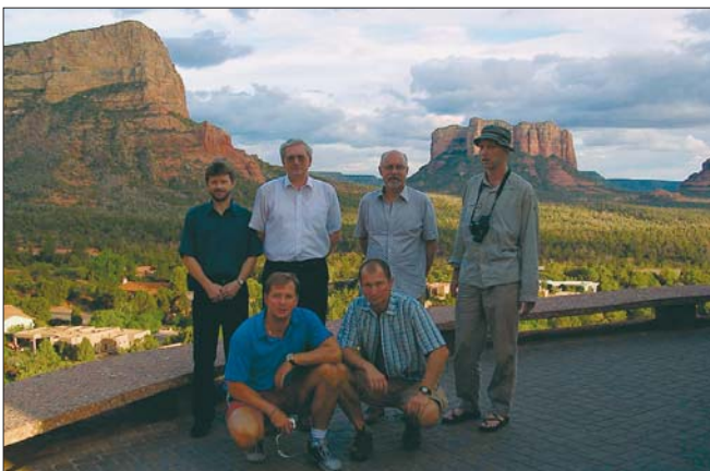
Při jednom z mála volných dnů si hejtmáni nenechali ujít příležitost zkontrolovat hloubku Grand Canyonu na vlastní oči.