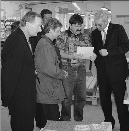
V Aši se hejtmán setkal nejen s občany města, ale zavítal i do místních firem.