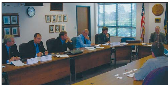
Při návštěvě Oregonu českou delegaci přijal guvernér státu.