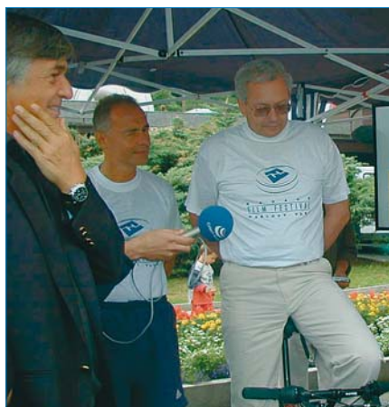
Při festivalu mohli milovníci filmů vyšlapat na speciálním kole elektrickou energii. Vydělané peníze putovaly na opravu karlovarského kina Čas.