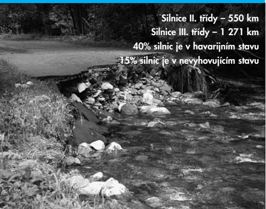
Takhle vypadaly některé ze silnic po loňských ničivých záplavách