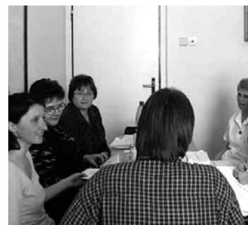
Interaktivní workshopy v jednotlivých zařízeních poskytujících sociální služby probíhaly v příjemné atmosféře.

„Odbor sociálních věcí i nadále intenzivně pracuje na řadě dalších aktivit spojených s dalším postupem v oblasti komunitního plánování a standardů kvality