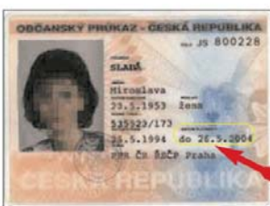
Občanský průkaz (vzor 93) bez strojově čitelných údajů a s lepenou fotografií držitele.

Vytvořil: Ministerstvo vnitra, odbor společenství, oddělení koordinace předpisů a kontrol a výjezů do zahraničí.