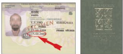
Cestovní pas (vzor 98) bez strojově čitelných údajů s termoplastickou fólií s hologramem přes pravý dolní roh fotografie a deskami zelené barvy.