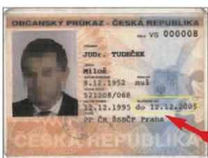
Občanský průkaz (vzor 94) bez strojově čitelných údajů a s lepenou fotografií držitele.