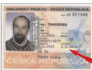
Občanský průkaz (vzor 96) bez strojově čitelných údajů a s hologramem přes pravý okraj lepené fotografie držitele.