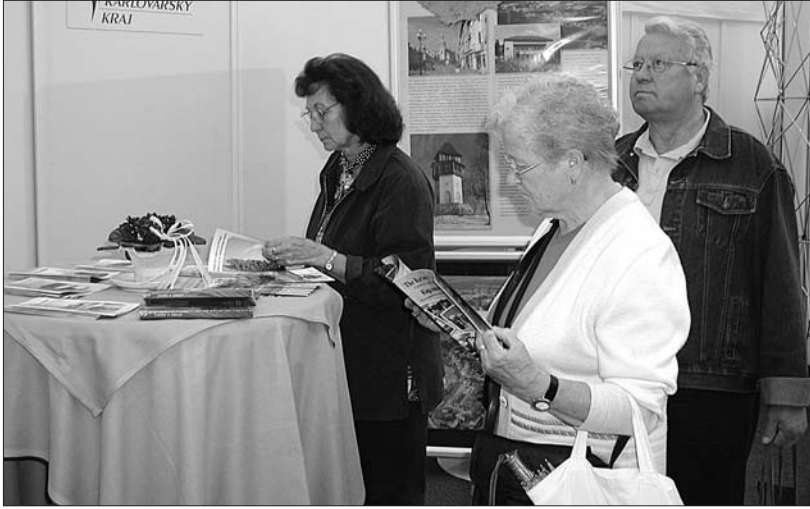
V bavorském Bayreuthu se 5. května prezentoval Karlovarský kraj ve spolupráci s RHK Poohří členům hornofrancké průmyslové a obchodní komory.

Horní Franky jsou třetím nejprůmyslovějším regionem Německa a v oblasti kooperace s Českou republikou zaujímá významnou pozici. Jen v Karlovarském kraji lze najít řadu firem pocházejících z tohoto regionu. Počínaje výrobcem stavebních materiálů Liapor, přes softwarovou firmu HSF a konče producentem technických textilií firmou Frenzelit. Podle Hungera by však na rozšíření Evropy mohly více vydat české firmy. „Společný