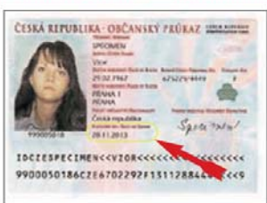
Občanský průkaz (vzor 2000 a 2003) se strojově čitelnými údaji a tiskovou podobou držitele.

Nový občanský průkaz s anglickým a francouzským překladem názvů položek se začne vydávat v roce 2005.