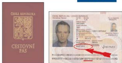
Cestovní pas (vzor 2000) se strojově čitelnými údaji, tiskovou podobou držitele a deskami v barvě burgundské červeně.

Nový vzor cestovního pasu České republiky s vyznačením příslušnosti k Evropské unii se začne vydávat v roce 2005, avšak i nadále bude možné cestovat na všechny zde uvedené vzory cestovních pasů České republiky, pokud jim neskončila doba platnosti.