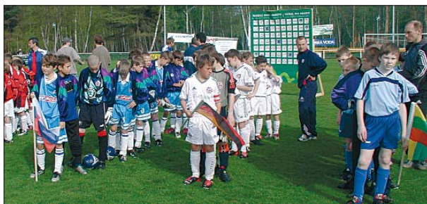
První den členství v EU hostily Františkovy Lázně 12 žákovských fotbalových týmů na mezinárodním turnaji.