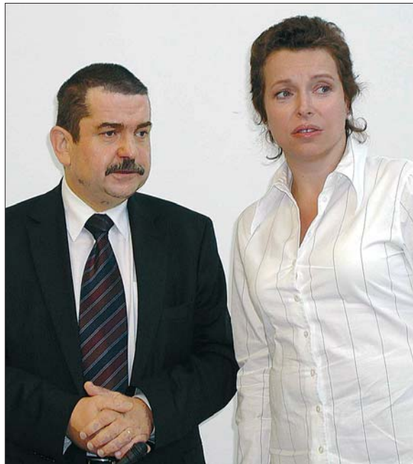
O možné podpoře státu projektu Modernizace Integrované střední školy technické a ekonomické v Sokolově jako centra celoživotního vzdělávání hovořil náměstek hejtmána Petr Horký s ministryní školství Petrou Buzkovou.