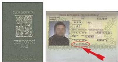
Cestovní pas (vzor 93) bez strojově čitelných údajů se samolepicí fólií a deskami zelené barvy.

Pro cestování v rámci členských států Evropské unie bude možno také použít všechny dosud platné vzory občanských průkazů České republiky typu karta, pokud jim neskončila doba platnosti .