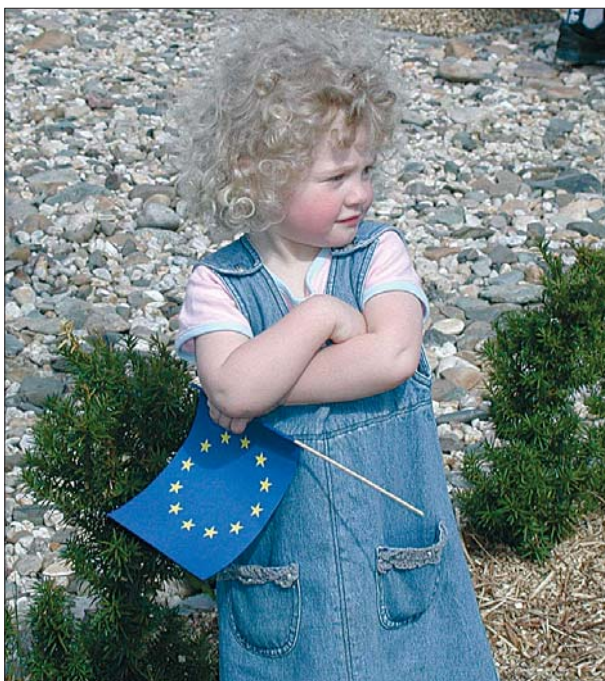
Oslav vstupů regionu do EU si v Karlových Varech užívali i naši nejmenší.