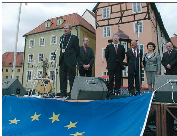
Vstup do unie oslavila s Chebem i řada zástupců jeho partnerských měst.