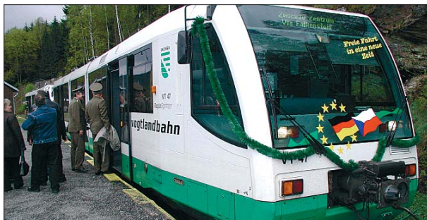
Vlaková souprava RegioSprinter přivezla 1. května kraslické do sousedního Klingenthalu k podpisu smlouvy o spolupráci obou měst.