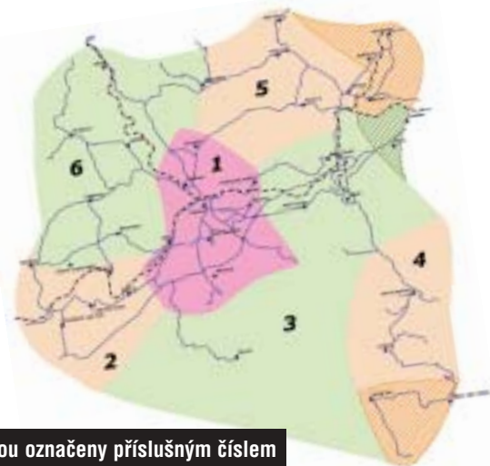
Zóny jsou označeny příslušným číslem

Zóna č. 5: Cestující dojíždějící denně ze zastávky Nová Role, sídliště do kombinátu Vřesová, který vlastní BČK, zaplatí u dopravce LIGNETA autobusy, s. r. o., za měsíc cca 706 Kč. Při využití časové jízdenky IDOK v zóně č. 5 platné v celém úseku z Nové Role do Vřesové zaplatí cestující za měsíc 400 Kč. Cestující tím, že využije 30-ti denní časovou jízdenku IDOK ušetří měsíčně 306 Kč.