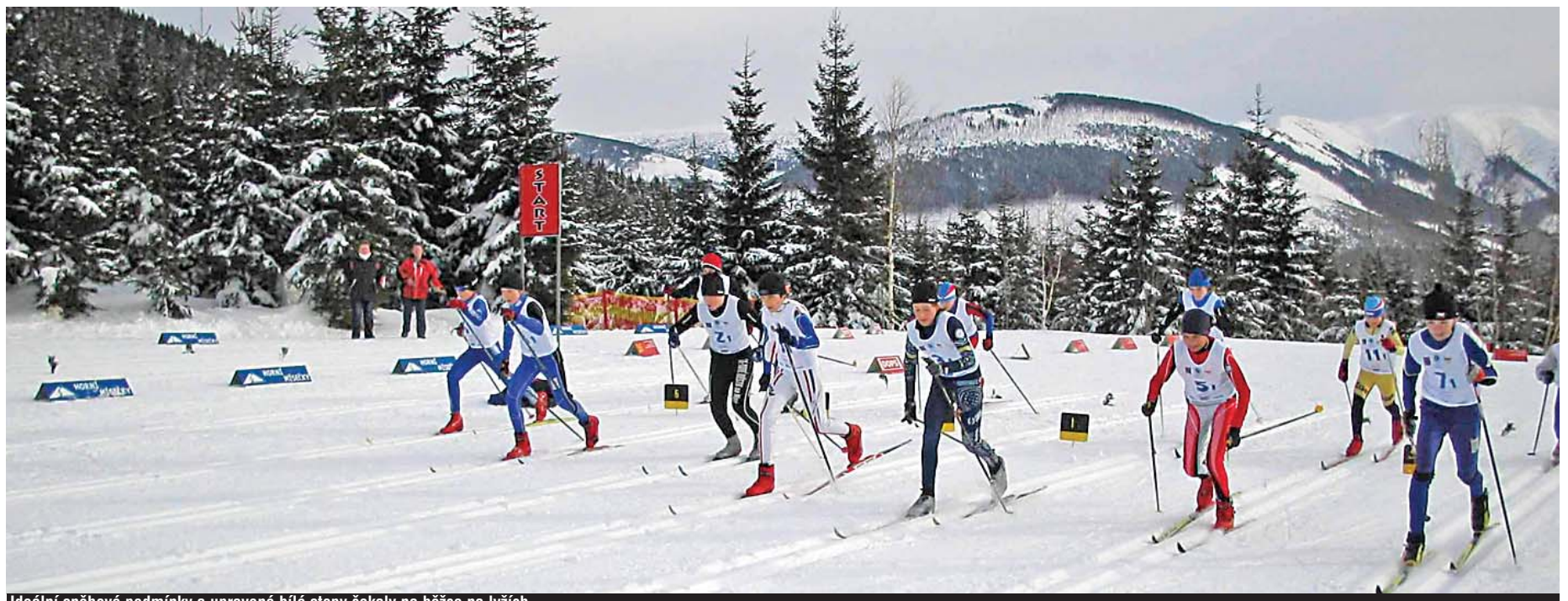
Ideální sněhové podmínky a upravené bílé stopy čekaly na běžce na lyžích.