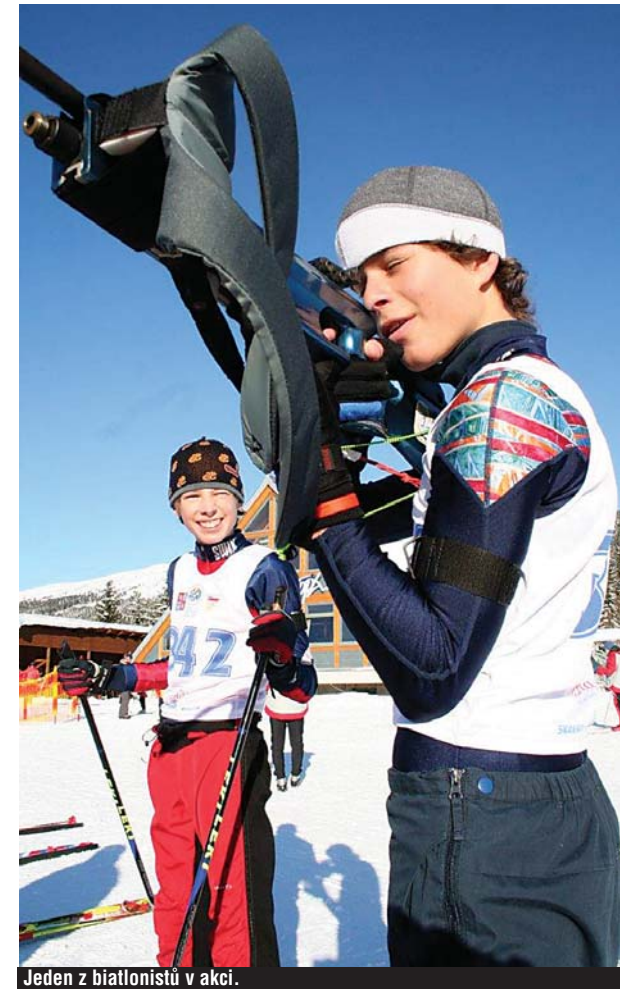
Jeden z biatlonistů v akci.