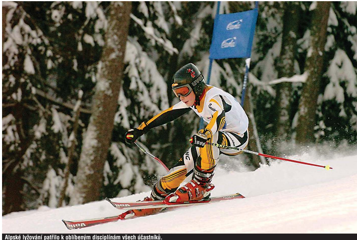
Alpské lyžování patřilo k oblíbeným disciplinám všech účastníků.

Děkujeme všem dětem a trenérům za skvělou reprezentaci Karlovarského kraje.