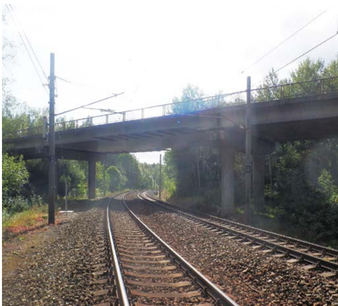
Most u Nového Sedla Pokud by nedošlo k urychlené opravě chátrajícího mostu, museli by jej silničáři kvůli velmi špatnému stavebně technickému stavu v nadcházejícím období zcela uzavřít.