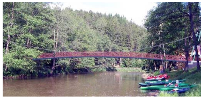
Nová lávka uleví stávajícímu dřevěnému mostu.