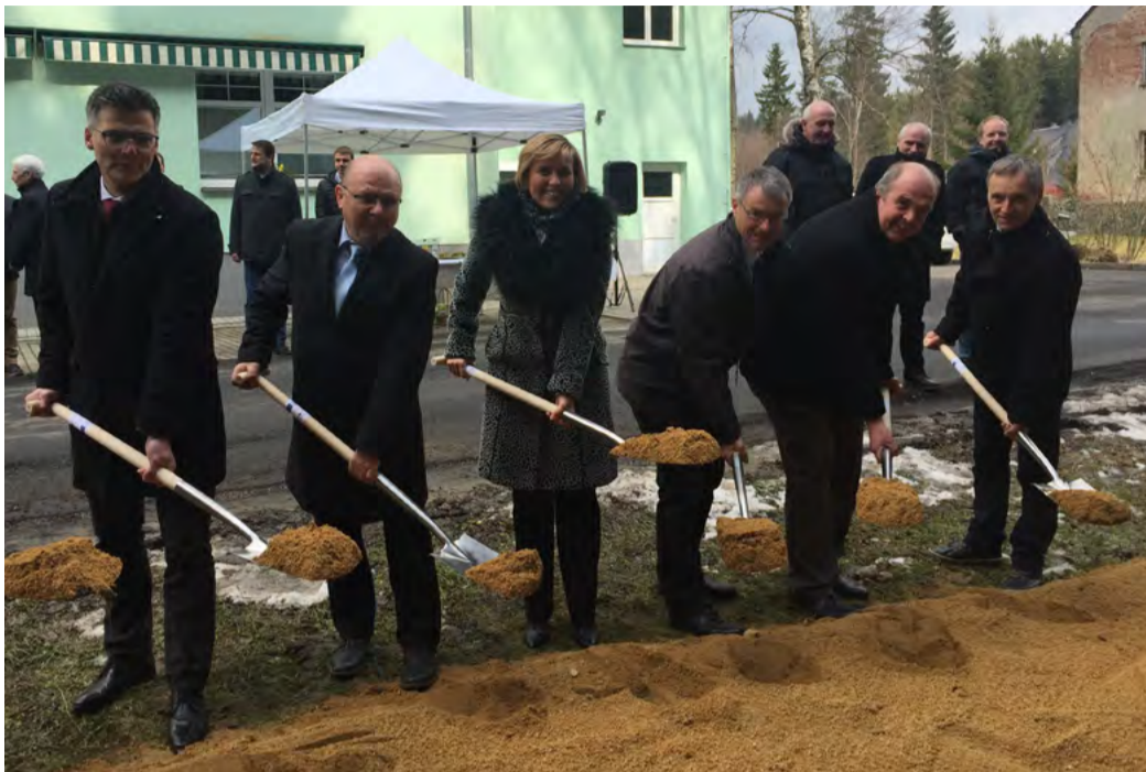
Moderní přeshraniční spojení Rekonstrukci silnice slavnostně zahájili koncem března představitelé Karlovarského kraje spolu se zástupci okresu Vogtland a starosty dotčených měst.

Projekt zahrnuje modernizaci silnice na české a německé straně