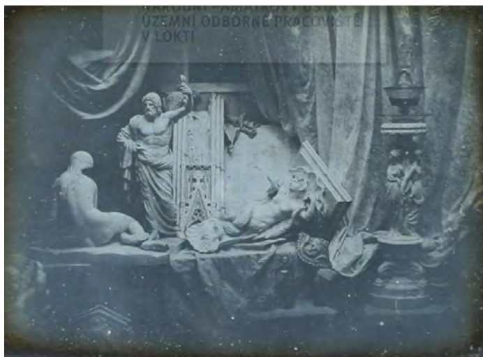
Kynžvartská daguerrotypie Jednu ze svých prvních daguerrotypií věnoval francouzský vynálezce Louis Daguerre v roce 1839 kancléři Metternichovi. Foto: KÚ

Kynžvartská daguerrotypie je jedna z prvních daguerrotypií, kterou pořídil francouzský vynálezce Louis Daguerre. Zachytil na ni motiv svého uměleckého ateliéru a v roce 1839 ji věnoval tehdejšímu majiteli zámku kancléři Metternichovi. Je mimořádná nejen proto, že je první svého druhu, ale také proto, že je na ni věnování od samotného objevitele. Základem pro daguerrotypii je vysoce vyčištěná kovová deska, která na rozdíl od fotografického papíru není pružná. (KÚ)