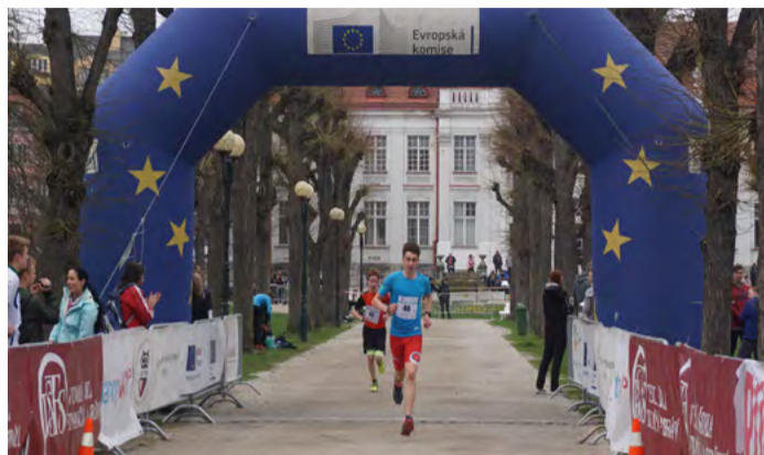
Semifinálové kolo V karlovských Smetanových sadech se na trať juniorského maratonu postavili žáci ze třinácti středních škol z kraje.

Juniorský maraton je unikátní sportovní projekt, kterého se každoročně účastní tisíce žáků středních škol. Akci provází mediální kampaň, jejímž cílem je podporovat kladný vztah mládeže ke sportu, zdravý životní styl, týmového ducha a preventivně působit proti užívání návykových látek. (KÚ)