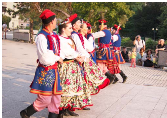
Karlovarský folklorní festival již po dvaadvacáté roztančí a rozezpívá kolonády a snad vykouzlí úsměvy na tvářích novým i stálým divákům i účinkujícím.

Zúčastněné zahraniční soubory budou velice rozmanité. Z největší dálky knám dorazí soubor až ze souostroví Kapverdy. Mexický folklor už mnoho let oslňuje místní diváky a je vždy zárukou kvality, proto nebude chybět ani folklorní soubor z Mexico City. Bojové tance z blízkého východu předvede turecký soubor z města Bursa. Typické ruské písně nám zahrájí