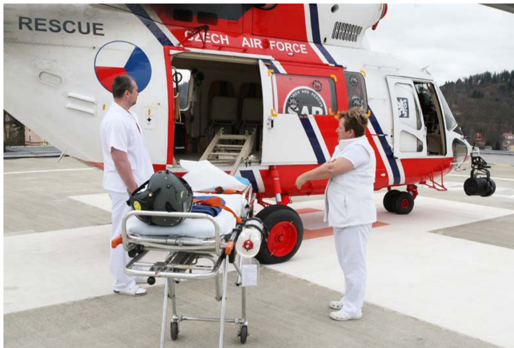
Letecká záchranka Heliport v karlovarské nemocnici se po dlouhých letech letos konečně podařilo zprovoznit také pro přistávání těžkých vojenských vrtulníků - na snímku je vrtulník PZL W-3 Sokół provozovaný Leteckou záchrannou službou Armády ČR Plzeň – Lině. Nyní Karlovarský kraj usiluje také o zřízení stanoviště pro leteckou záchranku.

Důvody jsou nasnadě. „Letecká záchranná služba je sice nákladná, ale také velmi důležitou součástí integrovaného záchranného systému ČR. Není to tak dávno, co se konečně po letech podařilo zprovoznit heliport v karlovarské nemocnici i pro těžké vojenské vrtulníky. Teď bychom se měli snažit o to, aby letecká záchranka měla své stanoviště v našem kraji. Je proto několik důvodů. Z hlediska pokrytí jsme na tom nejhůř ze všech krajů. Mají nás na starosti vrtulníky startující buď z Ústí nad Labem, nebo z Plzně. Tím pádem více než 80 procent obyvatel našeho kraje nemá zajištěnou leteckou záchranku tak, jako ostatní občané ČR. Přitom v regionu chybí specializovaná centra, tedy traumacentrum, popáleninové centrum, dětská resuscitační péče, komplexní cerebrovaskulární centrum nebo komplexní kardiovaskulární cent-