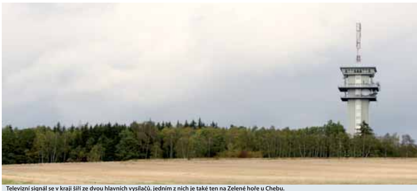
Televizní signál se v kraji šíří ze dvou hlavních vysílačů, jedním z nich je také ten na Zelené hoře u Chebu.