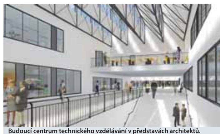
Budoucí centrum technického vzdělávání v představách architektů.

V bývalé Základní škole Klínovecká zhotovitel demontoval staré zařízení a vybavení budovy a provedl oplocení rozsáhlého staveniště. Zahájeny byly