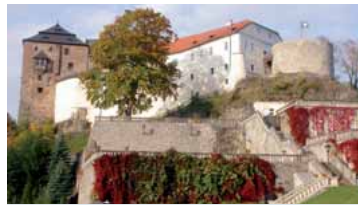
Bečov je jednou z nejvýznamnějších památek kraje.

Hrad Bečov se letos bude účastnit soutěže o prestižní mezinárodní Cenu Evropské Unie - Europa Nostra 2009. Do soutěže se přihlásil s projektem konzervace a prezentace hradu. Předkládá Národní památkový ústav, atelier Girska AT, ČVUT a další spolupracovníci, věří, že projekt bude kvalitně reprezentovat Českou republiku a Karlovarský kraj v oboru památkové péče v soutěži, která svým významem představuje „památkářskou olympiádu“.