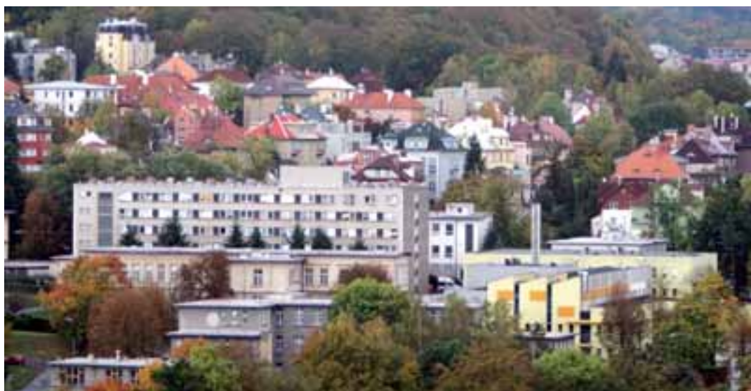
Rozvoj současných nemocnic limituje, mimo jiné, i fakt, že se všechny tři nacházejí přímo v centru měst. Na snímku část areálu nemocnice v Karlových Varech.