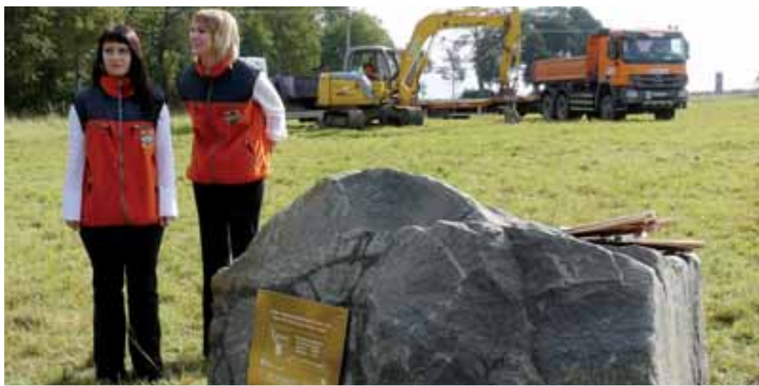
Stavba, která městu pomůže od problematické dopravy, bude hotová už za tři roky.

Obchvat Hranic se odklání od původní trasy silnice před městem, obchází ho po jeho západní straně a vrací se na stávající trasu v místě hraničního přechodu Ebmath. Stavba zahrnuje zbudování čtyř nových mostů, ale také výstavbu nebo úpravu dvou úrovněvých, jedné mimoúrovňové a jedné kruhové křižovatky. Stavba bude náročná i z hlediska ochrany životního prostředí. V tří-