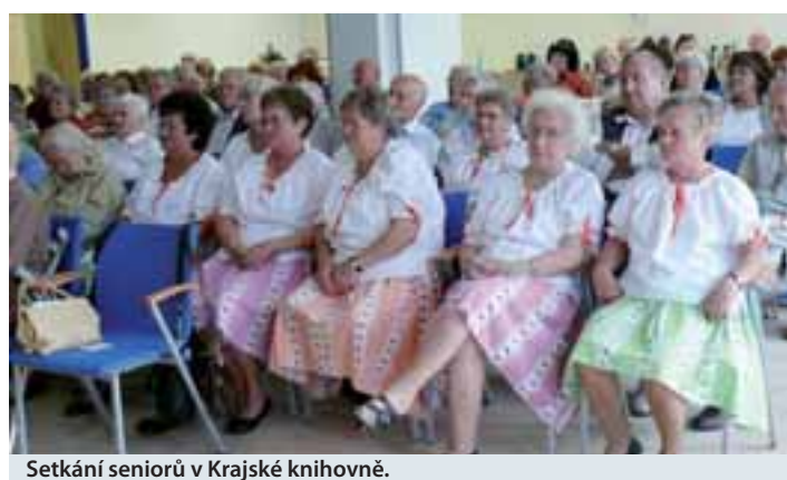
Setkání seniorů v Krajské knihovně.