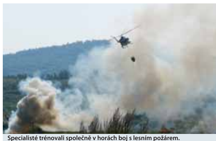
Specialisté trénovali společně v horách boj s lesním požárem.

Karlovarský kraj koncem září zažil největší hasičské cvičení ve své historii. To mělo za úkol v průběhu tří dnů prověřit záchranáře, jak zvládají rozsáhlý lesní požár. Odpovídal tomu i název samotné akce - Forest Fires 2009. Cvičení bylo nakonec jedinečné svým rozsahem nejen v Karlovarském kraji, ale i v celém Česku.