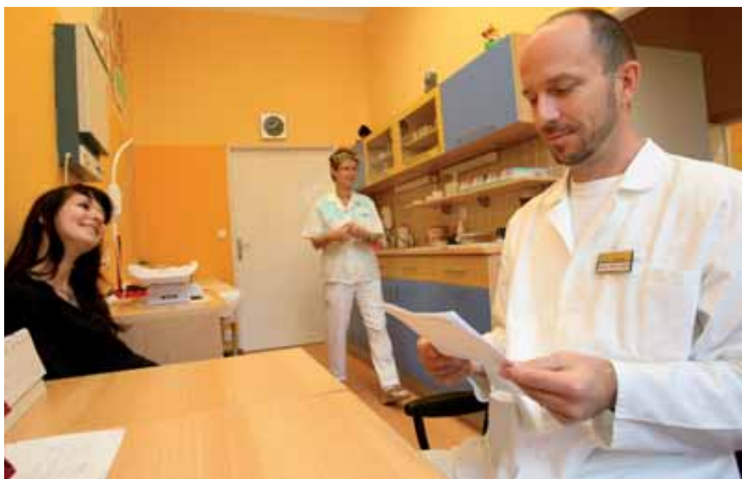
Nejvýraznější změnou lékařské služby první pomoci v Chebu je kompletně zrekonstruovaná ambulance v budově dětského oddělení chebské nemocnice.

Rovněž byl schválen materiál, který upravuje problematiku špatně, popř. nedostatečně vyplněných žádostí o proplacení daru. Pokud žádost nesplní všechny uvedené podmínky, bude zamítnuta, a zároveň tato informace nebude žadateli písemně oznámena. Požadavky těch, kteří si chtějí ověřit, zdali byla jejich žádost akceptována, budou vyřizovány telefonicky.