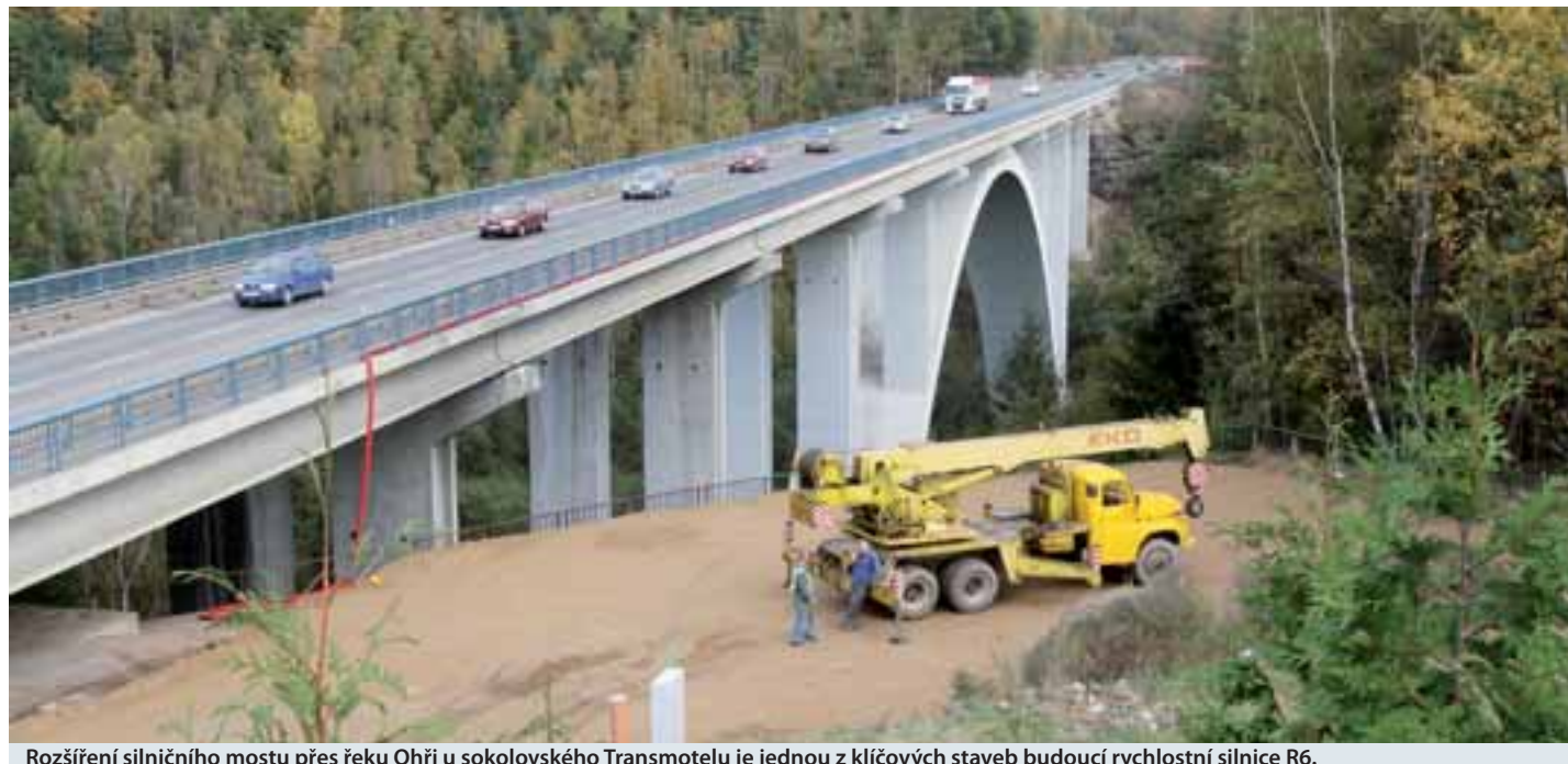
Rozšíření silničního mostu přes řeku Ohři u sokolovského Transmotelu je jednou z klíčových staveb budoucí rychlostní silnice R6.