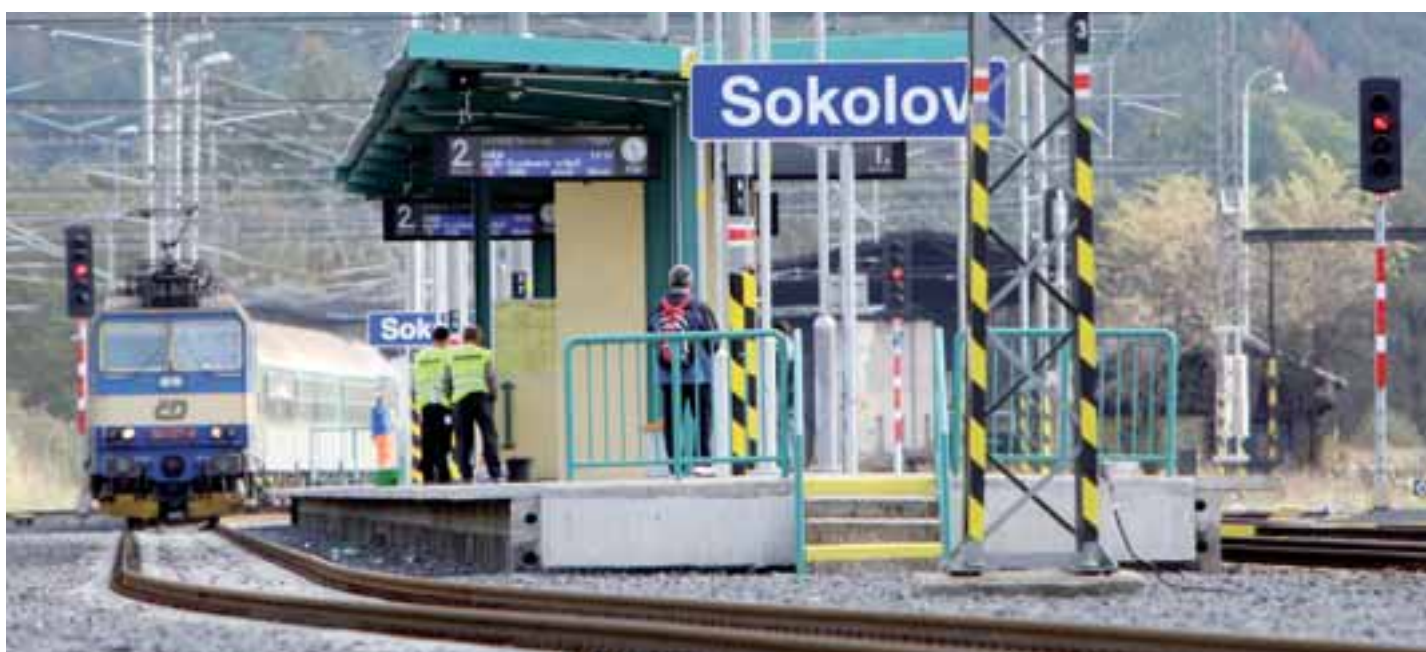
K zásadnímu zvýšení kvality poskytovaných služeb i inovacím vozového parku se budou muset zavázat dopravci v Karlovarském kraji. Výměnou za to získají smlouvy na zajišťování dopravní obslužnosti v kraji na dobu až deseti let. Na snímku nedávno zrekonstruované nástupiště nádraží v Sokolově.

I když mají firmy na splnění smluvních podmínek pět let, některá zlepšení se dají očekávat už dříve. Například kvalitní informační tabule, které kraj