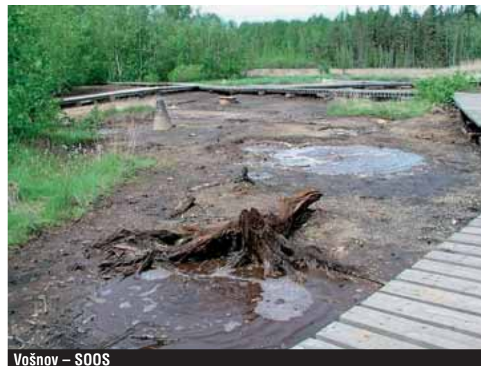
Vošnov - SOOS

Na karlovarské straně se řízení geoparku ujala Nadace Georgia Agricoli. V roce 2004 zadala vypracování rozsáhlé studie proveditelnosti k vytvoření koncepce základní infrastruktury v karlovarské části Česko-bavorského geoparku. V roce 2005 Česko-bavorský geopark přejímá Karlovarský kraj a tuto studii předkládá v rámci žádosti o Evropské peníze ze Společného regionálního operačního programu. Tato žádost neprošla hodnocením, což vedlo k rozpadu kompletního projektu na dílčí části, které se postupem času realizují a budou realizovat.