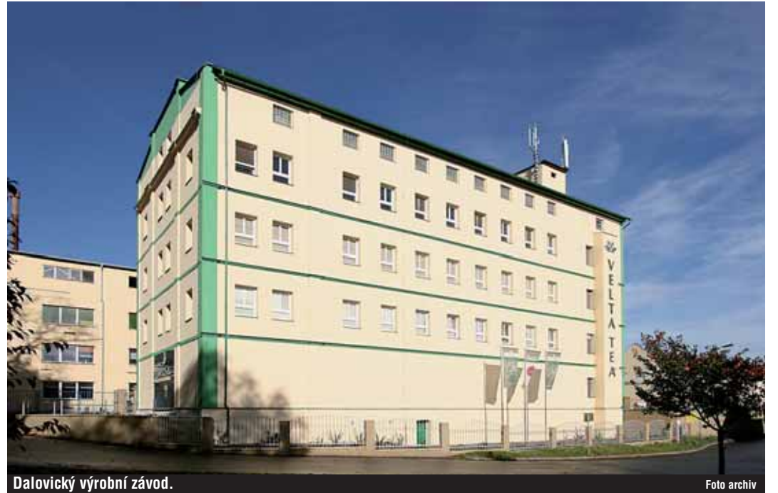
Dalovický výrobní závod.