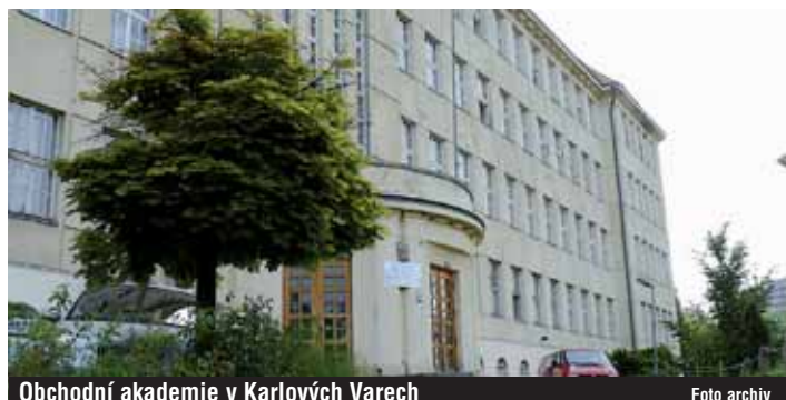
Obchodní akademie v Karlových Varech

Projekty z Operačního programu Vzdělávání pro konkurenceschopnost schválilo Zastupitelstvo Karlovarského kraje 16. října.