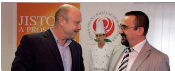
Nový hejtmán Karlovarského kraje, sociální demokrat Josef Novotný (vlevo) v den voleb.