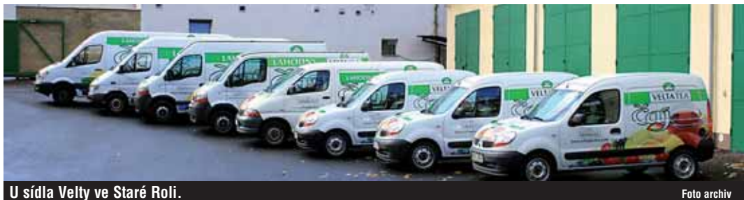
U sídla Velty ve Staré Roli.

Společnost Velta Plus EU, s. r. o., působí na českém trhu od roku 1995. Během této doby se stala jednou z největších firem v České republice zabývajících se výrobou, dovozem a prodejem tabákových výrobků a čajů. Obrat z činnosti společnosti za rok 2007 přesáhl 6,2 miliardy korun. To jí opětovně zajistilo umístění v žebříku Top 50 obchodů ČR, tentokrát s posunem dokonce na 15. místo (16. místo za rok 2006). Počet pracovníků společnosti v současné době dosahuje 120 osob. Společnost sídlí ve Staré Roli, v ulici Závodu míru.