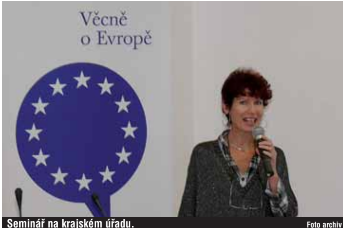
Seminář na krajském úřadu.

Po ukončení cyklu regionálních seminářů se mohou zájemci o modelové zasedání stát stálými zástupci jedné ze sedmadvaceti členských zemí EU. Následovat budou přípravná jednání v Olomouci a závěrečná simulace skutečného jednání na vrcholné úrovni. Projekt Rozhoduj o Evropě, který realizuje sdružení Eutis, získal záštitu Ministerstva