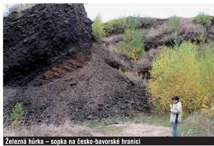
Železná hůrka - sopka na česko-bavorské hranici