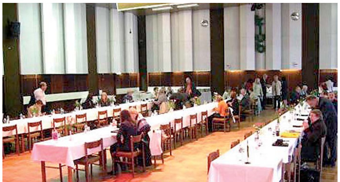
Karlovarský kraj a město Chodov uspořádaly konferenci Budoucnost.

Ze pracovních sil určitých oborů chybí už dnes, již například Chodov. „Investoři, kteří k nám míří, se nás ptají nejen na pozemky, ale také shánějí kvalifikované zástupce a my jim mnohdy nemáme co nabídnout. Po revoluci se v tomto směru hodně zaspalo a nyní je po učňovských