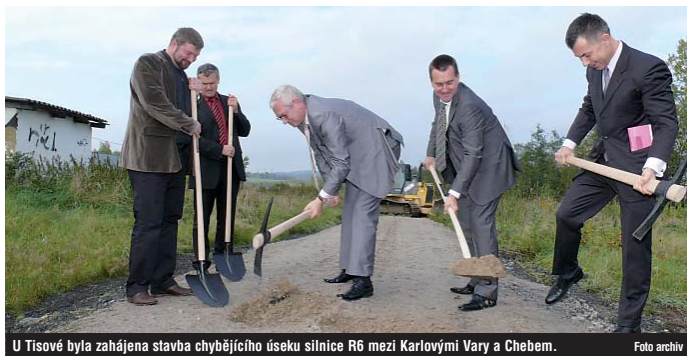
U Tisové byla zahájena stavba chybějícího úseku silnice R6 mezi Karlovými Vary a Chebem.

komunikací – silnic II. a III. třídy a místních komunikací města Březová. Výstavba komunikace a provoz na ní bude maximálně šetrný vůči životnímu prostředí. V rámci přípravy, výstavby a samotného provozu budou dodrženy požadavky dokumentace EIA, která posuzuje vliv staveb na životní prostředí a zasažená zelen tak bude v oblasti kompenzována náhradní výsadbou. Pro vozidla, kterým platná legislativa neumožňuje užívání silnice pro motorová vozidla, je v úseku mezi mimoúrovňovými křižovatkami Tisová a Březová navržena souběžná doprovodná komunikace, která bude začleněna do sítě silnic Karlovarského kraje jako silnice II. třídy II/606. Zbylým