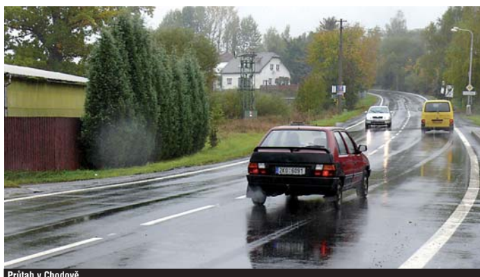
Průtah v Chodově