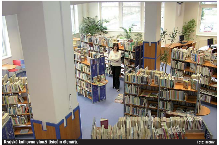
Krajská knihovna slouží tisícům členářů.