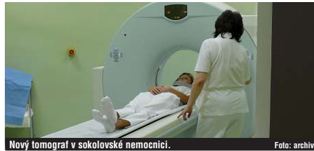
Nový tomograf v sokolovské nemocnici.