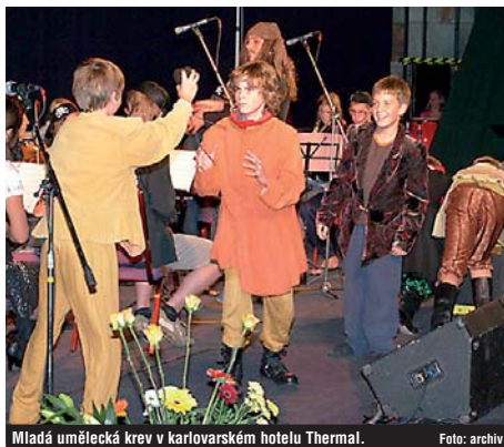
Mladá umělecká krev v Karlovarském hotelu Thermal.