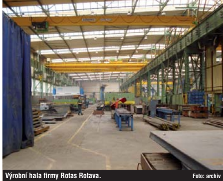
Výrobní hala firmy Rotas Rotava.

Těžko říci, kde nastal ten zlom, skutečnost ale je, že učňovské obory a průmyslové školy buď zanikly, nebo se redukovala jejich odbornost a výtečnost. Mladí dnes, s vidinou budoucnosti v sáčku s kravatou a spoustou peněz, absolvovali školy s obecným a povrchným zaměřením, a podle toho pak vypadá i jejich