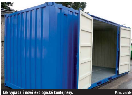
Tak vypadají nové ekologické kontejnery.