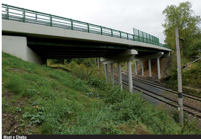
Most v Chebu