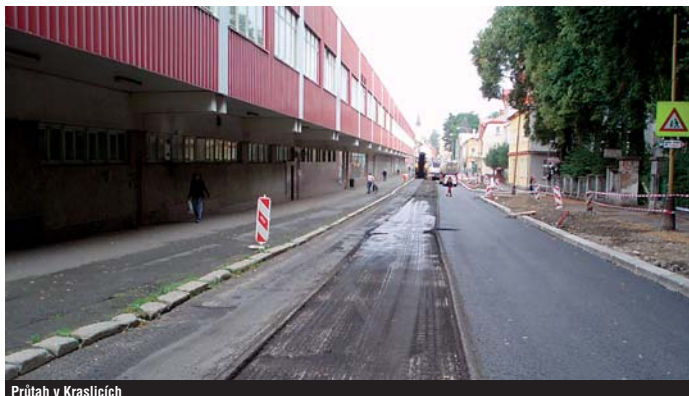
Průtah v Kraslicích