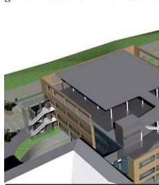
Plánovaná podoba nové budovy karlovarské nemocnice.

z operacího programu Doprava. Kromě zahájené stavby už v Karlovarském kraji pokračuje od října roku 2006 stavba trasy silnice R6 mezi Kynšperkem a Tisovou na Sokolovsku. Úsek dlouhý 7,5 kilometru přijde na 2,42 miliardy korun a bude sloužit v polovině roku 2009. V říjnu 2008 byla zahájena stavba úseku R6 Sokolov–Tisová. Rychlostní komunikace bude dokončena na hranici regionu v roce 2011. Pokračovat