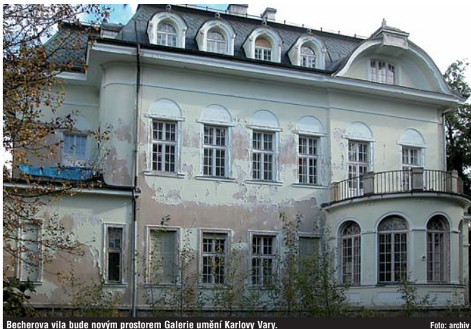
Becherova vila bude novým prostorem Galerie umění Karlovy Vary.

Zásadní investice pro nás bude výstavba nového pětipodlažního pavilonu akutní medicíny a centrálního vstupu v areálu nemocnice v Karlových Varech za zhruba půl miliardy korun. Dalších asi 300 milionů plánujeme rozdělit mezi nemocnice v Karlových Varech, Sokolově a Chebu na zdravotnickou techniku a nákup technologií pro specializované výkony. V Sokolově a Chebu by postupně měly být zrealizovány pavilony centrálního vstupu. Ještě v tomto roce tak investujeme v Sokolově osm a v Chebu šest milionů korun. Výstavbou karlovarského pavilonu chceme zajistit nemocnici schopnost konkurovat sousedním regionům, Plzeňskému a Ústeckému kraji, i Praze, kam pacienti dojíždějí za specializovanou péčí. Plánovaná výstavba by neměla ovlivnit chod krajské nemocnice a komplikovat běžný provoz v tomto zařízení.