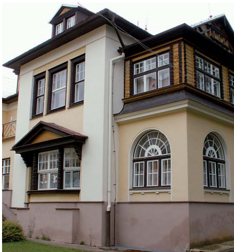
Kraj úspěšně rekonstruoval budovu domova pro seniory v Kynšperku.