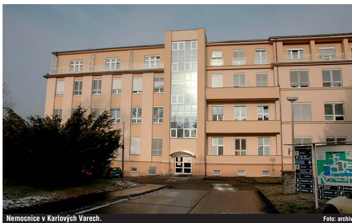
Nemocnice v Karlových Varech.

Smlouva však, alespoň pokud já mohu soudit, nikdy nebyla naplněna. Chyběla zřejmě schopnost a možná ochota vedení samostatných nemocnic a jejich týmů se na jakýchkoli významných změnách dohodnout. Vznikl jediný Karlovarský krajské nemocnice, a. s., k 1. 2. 2006 (no-