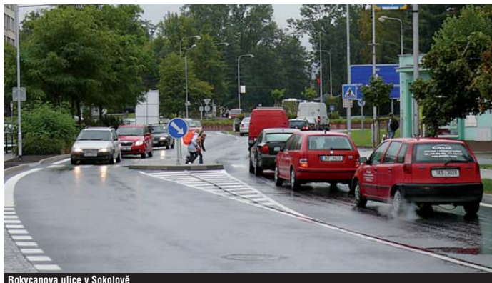
Rokycanova ulice v Sokolově