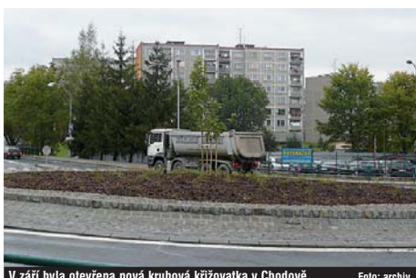
V září byla otevřena nová kruhová křižovatka v Chodově.

ní silnicí nákladní dopravou ze Sokolovské uheřné nebo Liasu Vintřív. Stále to ale nestačí. „Silnice jsou sice lepší a bezpečnější, ovšem prioritní je pro nás stavba obchvatu města. Mohla by se snad realizovat v letech 2010 až 2015,“ poznamenal Hora.