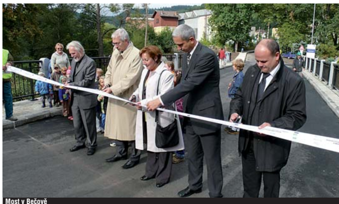
Most v Bečové