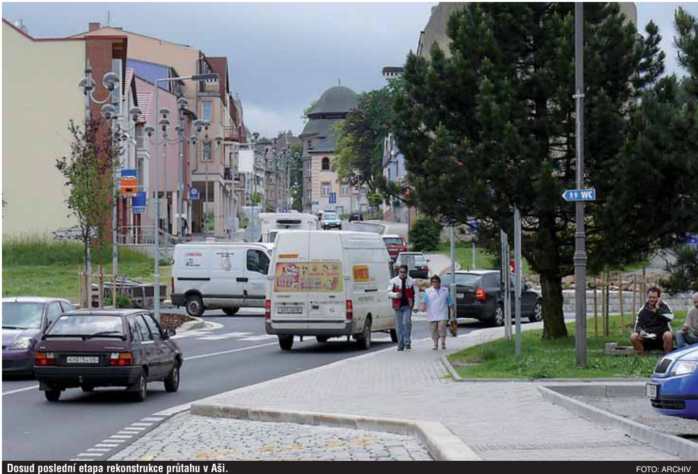
Dosud poslední etapa rekonstrukce průtahu v Aši.

Záměrně nepokládám pátou logickou otázku týkající se porovnání nového silničního infrastrukturního majetku, tj. otázku investic. Jednak na toto téma byla o investičních záměrech Karlovarského kraje publikována řada článků různých autorů včetně mě, a co je podstatné, lze v tomto případě využít dotací ze strukturálních fondů EU. Dále si musíme uvědomit i další souvislosti. Silniční infrastruktura vznikala dlouhodo-