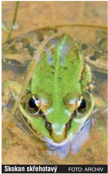
Skokan skřehotavý

Na závěr seriálu o 21 evropsky významných lokalitách, jejichž ochranu zabezpečuje Karlovarský kraj, vás zavedeme na území EVL Bochov, EVL Vysoký Kámen, Týniště a Bystřina – Lužní potok.