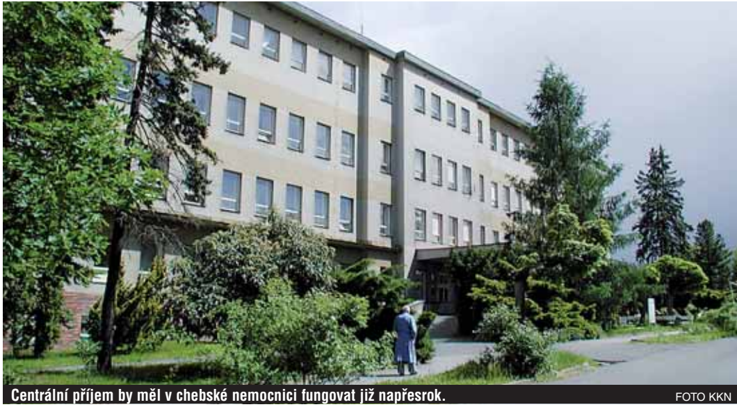
Centrální příjem by měl v chebské nemocnici fungovat již napřesrok.

Centrální příjem bude umístěn v hlavní budově, nejstarší části nemocničního areálu, jenž letos slaví stoleté výročí svého