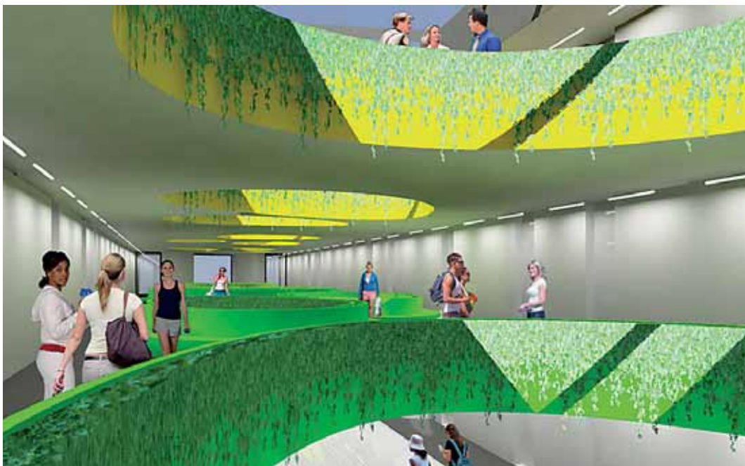
Tak má vypadat Centrum technického vzdělávání v Ostrově

Velká změna čeká také stovky studentů v Integrované střední škole technické a ekonomické v Sokolově: namísto dvou současných objektů by měla vyrůst nová sedmipodlažní budova s tělocvičnou, kapacita školy by se měla zvýšit ze 750 na 1100 studentů, a pokrýt tak zájem o jednotlivé obory studia studentů