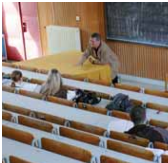
Nedostatek žáků vede ke slučování škol.

Nejvíce emocí patrně vyvolal přesun proslulé houslařské školy z Lubů do Chebu, kde se stala součástí tamní Integrované střední školy zemědělské a manažerské. Po mnoha letech zmizelo z Abertam učiliště vychovávající budoucí lesní specialisty. Učiliště bylo začleněno do střední lesnické školy ve Žluticích. Jako poslední bylo letos v červnu zrušeno střední odborné učiliště v Kynšperku a přičleněno ke Střední škole živnostenské v So-