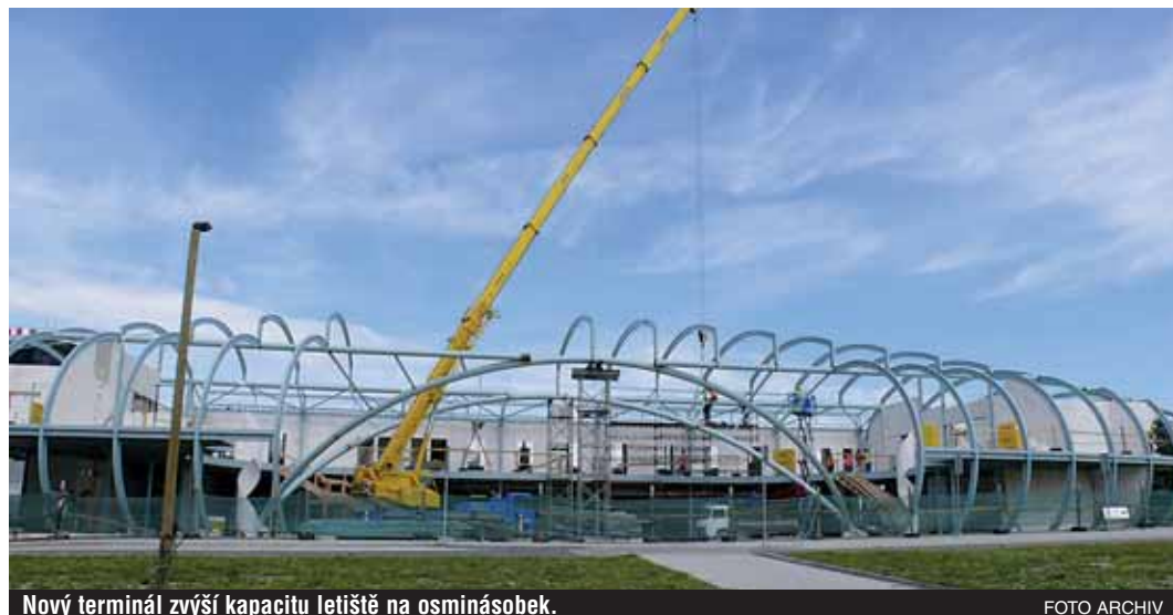
Nový terminál zvýší kapacitu letiště na osminásobek.

Přestavba mezinárodního letiště v Karlových Varech-Olšovských Vratech je první úspěšný projekt na severozápadě Čech, jemuž byla přiznána v plánovacím období 2007 až 2013 dotace z Evropské unie.