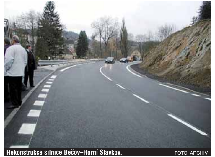
Rekonstrukce silnice Bečov–Horní Slavkov.

Ke kvalitě. Výrazně se zlepšila, o tom nemůže být pochyb. I já ovšem ještě někdy za hranicemi postřehnu rozdíly. Materiály, technologie i stroje jsou stejné, v čem to tedy asi může být?!