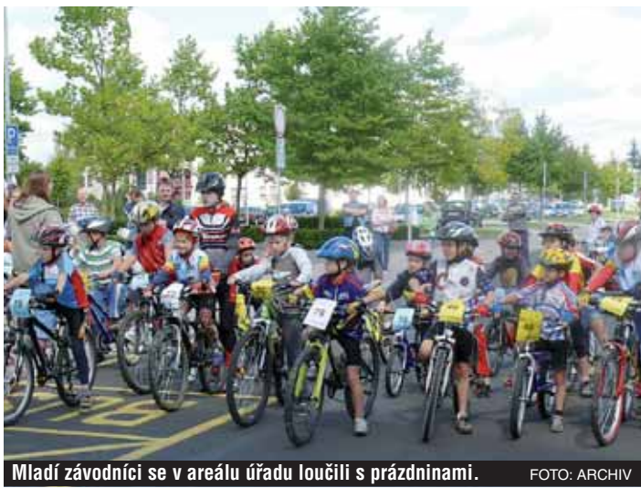
Mladí závodníci se v areálu úřadu loučili s prázdninami.

Celkem stovky účastníků přilákala v sobotu 23. srpna do karlovarských Dvorů trojnásobná akce: otevření nového dětského hřiště, první ročník dětského dnu a cyklistické závody pro děti všech věkových kategorií. Prostor administrativního areálu, jindy místa zcela seriózního, tak s vervou zaplnily naděje národa od kojenců po adolescenty.