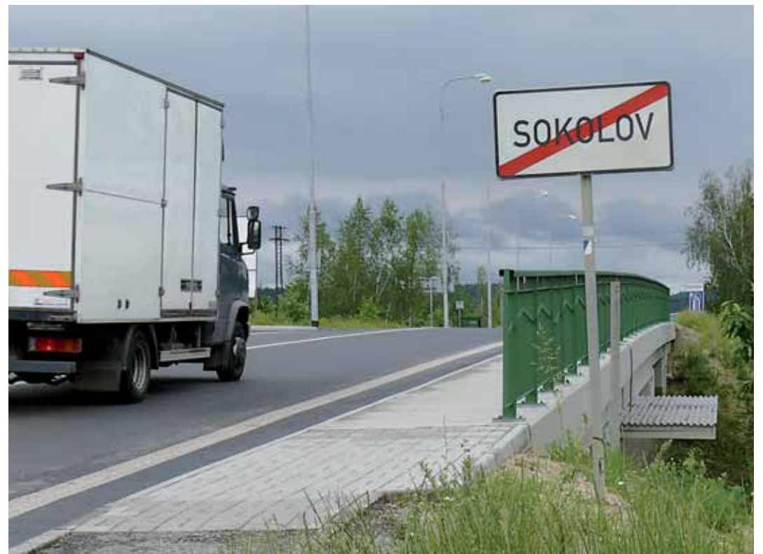
Údržba silnic po bavorském způsobu (na snímku rekonstruovaný most mezi Sokolovem a Svatavou) by přišla na půl miliardy korun ročně.

Otázka č. 4.: Jednorázové náklady ve výši 2,8 miliard korun nemůže uhradit nikdo jiný než stát. Zvýšené provozní náklady o cca 585 milionů korun ročně nemůže uhradit nikdo jiný než kraj. Selský rozum i pánové z Evropské komise mluví kupodivu stejně: Nepořizujte si majetek, na jehož provozování nemáte peníze.