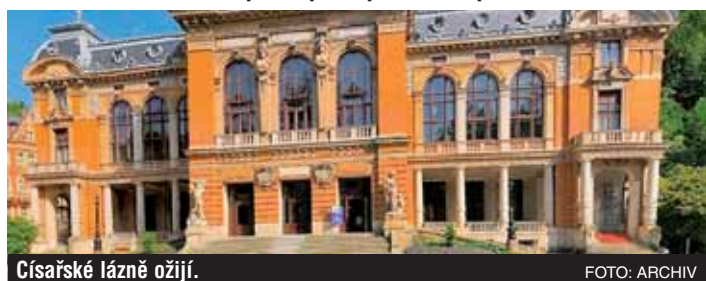
Císařské lázně ožijí.

Podpisem smlouvy o převodu objektu Císařských lázní z majetku města Karlovy Vary do vlastnictví kraje se otevřela cesta k obnově historického klenotu a jeho zpřístupnění veřejnosti.