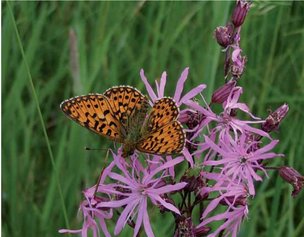
Hnědásek chrastavcový

Poslední ze série evropsky významných lokalit, s nimiž jste se měli možnost seznámit prostřed-