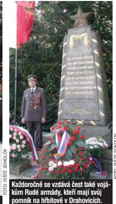
Každoročně se vzdává čest také vojákům Rudé armády, kteří mají svůj pomník na hrbitově v Drahovicích.