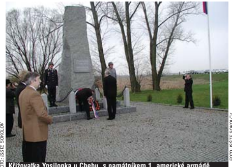
Křížovka Ypsilon u Chebu, s památníkem 1. americké armády, která osvobodila západní Čechy.