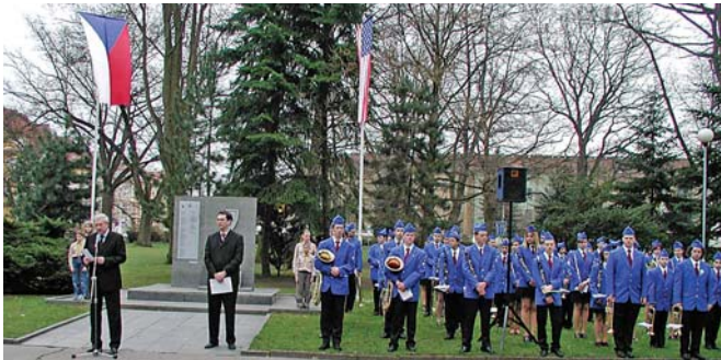
Památník v Městských sadech v Chebu je památníkem 97. pěší divize armády USA, která osvobodila Cheb 26. dubna 1945.

Vzpomínkové akty byly nejen připomínkou váleku zmařených životů, ale i důležitým momentem pro nastupující generace, aby se toto temné období světových dějin již nikdy neopakovalo. Je smutným faktem, že pro Československou republiku, především pro její příhraniční kraje, trvala válka nejdéle. Začala pro nás již jednáním v Mnichově koncem září 1938, po kterém tehdejší Československo ztratilo takzvané Sudeťtí, aniž o ně mohlo bojovat. Skončila na přelomu května a června roku 1945, kdy do naší země dorazily od východu a od západu dvě spojenecké armády, sovětská Rudá armáda a americká US Army.