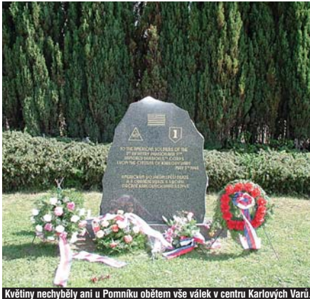
Květiny nechyběly ani u Pomníku obětem vše válek v centru Karlových Varů.