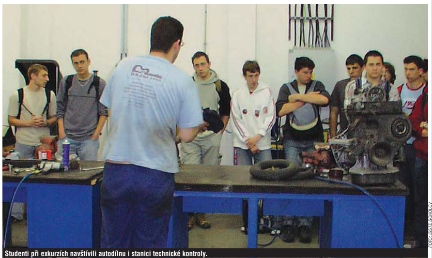
Studenti při exkurzích navštívili autodílnu i stanici technické kontroly.