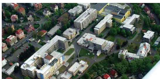
Zmodernizovaný areál karlovarské nemocnice – podle ministra zdravotnictví jsou krajské nemocnice plně diletantů a mříží ke krachu.

David Rath naznačil, že já a můj kolegové budeme na indexu ministerstva zdravotnictví a už nikdy nemáme šanci na léčbu v některé z pražských nemocnic. To je z úst prozatímního ministra zdravotnictví závažný výrok, svědčící o tom, že slovo demokracie vnímá asi jinak než ostatní. Myslím si, že podobné výroky si ve svém postavení nesmí dovolit a veřejnost by mu je rozhodně neměla tolerovat. Ale co čekat, dosavadní vlády a jejich ministři nikdy neměli hejtmány příliš v lásce. Daleko nebezpečnější a nepochopitelnější je, že pan Rath vidí svět jinak než většina normálních lidí. Vidi VZP prosperující místo VZP visící nad propastí. VZP, která pod jeho vedením s sebou stáhla i všechny ostatní, do té doby zdravé a fungující pojišťovny. VZP, do které stát letos nallil miliardy korun, a dokud se nezmění systém financování zdravotnictví, bude to muset dělat brzy opět a pak už napořád.