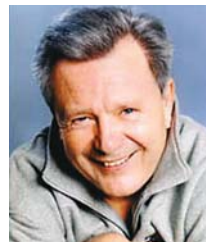
Samarský guvernér Konstantin Titov.

„Karlovarský kraj je cílem mnoha turistů, z Ruska ho navštíví dokonce několik tisíc hostů za měsíc. Mezinárodní letiště, které se nachází v blízkosti hlavního města kraje a z kterého by pravidelná linka Karlovy Vary-Samara létala, by tak mohlo být