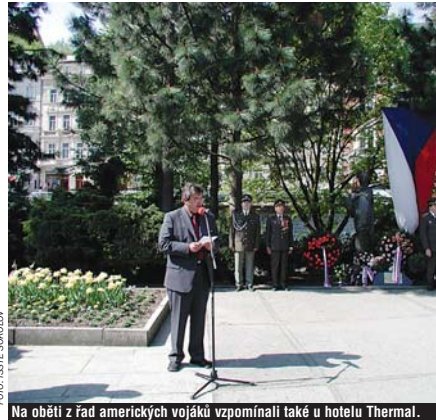
Na oběti z řad amerických vojáků vzpomínali také u hotelu Thermal.