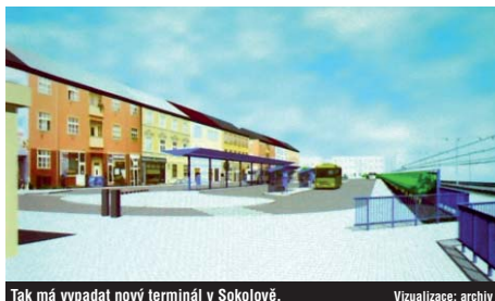
Tak má vypadat nový terminál v Sokolově.

Nejdále je s přípravou projektu město Sokolov, které má vydáno stavební povolení. Předpokládané náklady na výstavbu terminálu činí 100 milionů korun. V nejbližších dnech musí být podána žádost o dotaci – nejzazší termín je 22. ledna 2009. Stavba v Sokolově se bude skládat z vlastního