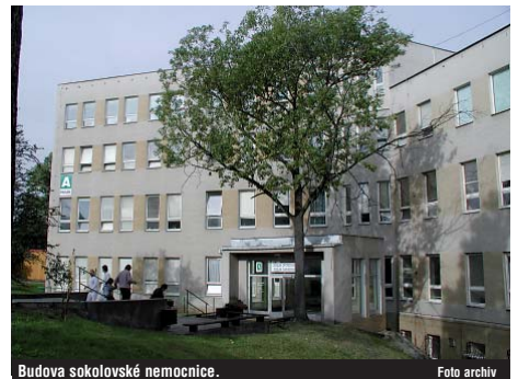
Budova sokolovské nemocnice.

Objekt se nachází ve stávajících prostorách vstupní spojovací chodby mezi pavilony B a C, včetně propojovací haly na oddělení ARO a radiodiagnostického oddělení pavilonu B (RTG, magnetická rezonance, CT, které se v současné době realizuje).