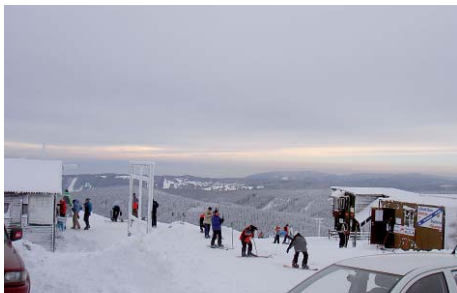
Lyžaři na Božím Daru si budou užívat zmodernizovaných běžeckých tras.

Celkem 334 tisíc korun vydá kraj ze svého rozpočtu obcím a Sdružení centrální Krušnohoří v rámci podpory budování a údržby lyžařských běžeckých tras.