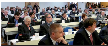
Zastupitelé Karlovarského kraje jednají před kamerami.

Přímý přenos jednání krajského zastupitelstva sledovalo asi 300 lidí. Takový byl počet zájemců, kteří si ve čtvrtek 18. prosince nechali ujít na internetu přenos zasedání Zastupitelstva Karlovarského kraje. Online vysílání zajišťila externí společnost, která jednání snímala na tři kamery a výstup vysílání v reálném čase doplnila o grafické prvky včetně titulků.