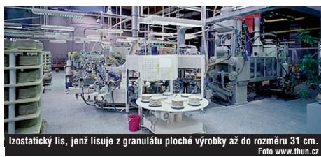
Izostatický lis, jenž lisuje z granulátu ploché výrobky až do rozměru 31 cm.