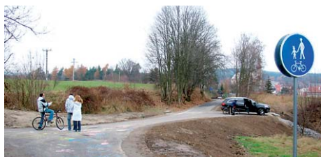
Karlovarský kraj do cyklostezek investuje dlouhodobě.

Karlovarský kraj chce letos investovat 140 milionů korun do budování páteřní cyklostezky podél řeky Ohře. Finanční krytí projektu a podání žádosti schválila na svém posledním jednání krajská rada, definitivní souhlas by mělo dát zastupitelstvo. Rekl to hejtman Karlovarského kraje Josef Novotný.