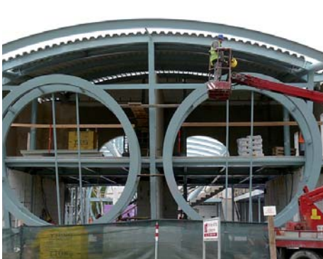
Budova nového karlovarského letiště začne sloužit na jaře 2009.

Zadatelé o evropské dotace z Regionálního operačního programu Severozápad, který je určen pro Ústecký a Karlovarský kraj, loni podepsali smlouvy za 8,9 miliardy korun. Získá je celkem 99 různých projektů. Podle Petra Vráblíka, ředitele úřadu regionální rady, která má dotace na starosti, je to zhruba 45 procent částky, kterou má program do roku 2013 k dispozici.