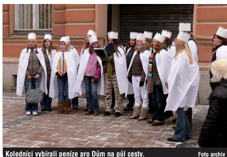
Koledníci vybírali peníze pro Dům na půl cesty.

Po plzeňské diecézi, která zahrnuje Plzeňský a Karlovarský kraj, se letos vydalo do měst a obcí na 850 skupinek koledníků. V minulém ročníku, kdy se ve sbírce v diecézi vybralo 2,57 milionu korun, chodilo zhruba o stovku skupinek koledníků méně. Se zabezpečnými kasičkami chodili od domu k domu prosit o příspěvky na potřebné. Na dvěře napsali křídou K-M+B 2009, což z latinského Kristus Mansionem Benedicat znamená Kristus zehnej tomuto domu.