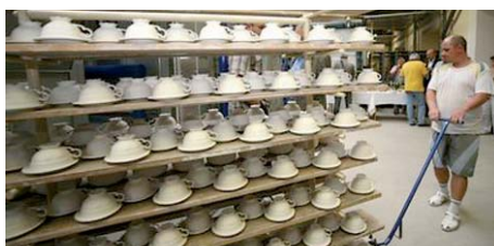
Více než šesti stům zaměstnanců Karlovarského porcelánu hrozí propuštění.

Zaměstnanci Karlovarského porcelánu jsou v současné době na nucené dovolené, pobírají pouze 60 % mzdy. „Výroba se znovu rozejde 26. ledna,“ sdělil náměstek hejtmana Miloslav Cermák. Podle