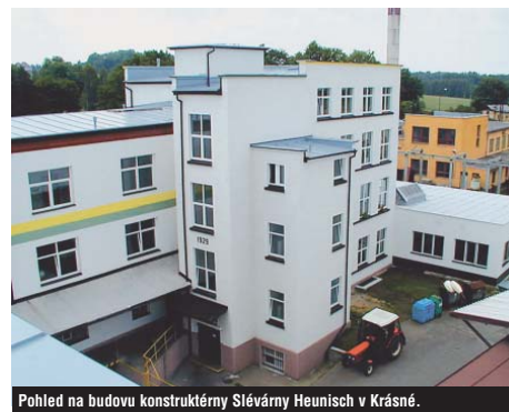
Pohled na budovu konstruktérny Slévárny Heunisch v Krásné.

Slévárna Heunisch nezaostává ani úrovní svého sociálního programu; i v tomto ohledu je nad celostátním průměrem. Svým zaměstnancům poskytuje například týden dodatkové dovolené, vlastní stravování, pracovníkům na slévárenských pracovištích dalších pět dní volna na rehabilitaci, odměny při významných životních a pracovních jubileích, příspěvky na ubytování a do-