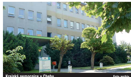
Krajská nemocnice v Chebu.

Karlovarská krajská nemocnice (KKN) bude muset dokládat vedení Karlovarského kraje čtvrtletně výsledky hospodaření. Tyto výsledky musejí být vyrovnané. Je to jeden z úkolů, kterým nová krajská rada pověřila management krajské akciové společnosti, pod kterou spadají nemocnice v Karlových Varech, Chebu a Sokolově. Až do zpracování zdravotní koncepce krajských nemocnic by se také nemělo ru-