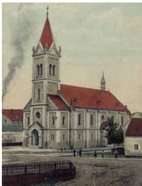
Kostel v roce 1919

Ve Staré Roli kvetla od poloviny 19. století řemesla i obchod a dobře fungovaly služby. Jen za I. republiky bylo ve Staré Roli 27 hostinců, tři hotely, osm pekáren a tři kavárny. Svě služby tu nabízelo 12 holičů, 14 řezníků, čtyři zlatníci a hodináři, 11 obchodů s konfekcí, dva koňští řezníci, dva knihkupci, byla zde tři květinářství, tři železářství a dvě drogerie. Vedle sebe se užívalo šest stavebních a pokrývačských firem, čtyři uhlíři, pět obchodníků s koženým zbožím a kožešnictví. Ve Staré Roli bylo 16 obuvníků, 6 čalouníků, 17 krejčíků a švadlen, 11 truhlářů, tři vetešníci, čtyři mandly a 23 prodejny potravin. Byly zde dvě majitelky módních salonů, osm hudebníků, dva kováři, dvě vinotéky, 7 trafik, 23 soukromých dopravců a tři opravy aut, 16 registrovaných trhvců a dalších 28 živnostníků. Po dvojnásobné žádosti v letech 1910 a 1922 bylo povýšení Staré Role na město potvrzeno 16. 7. 1926 a oznámeno dekretem ministerstva vnitra z 27. 7. 1926. Stará Role byla městem téměř padesát let. Dnem 1. 1. 1976 se stala součástí Karlových Varů.