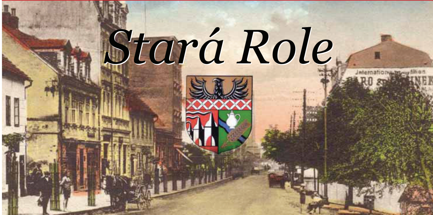
Historie Staré Role kráčela zejména Hlavní ulicí (Hauptstrasse, dnešní Závodu míru). Městský znak, jak ho navrhl prof. Waldemar Fritsch.

Městská část Stará Role se rozkládá na severozápadním okraji Karlových Varů a má rozlohu 529 hektarů. Průměrná nadmořská výška je kolem 392 m/m. Území je tvořeno údolím řeky Rolavy s nejvyššími vrcholy Bažantím vrchem (417 m/m.) a Kukačkou (438 m/m.).