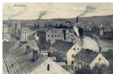
Pohled na porcelánku Epiag v roce 1909

Zatímco v roce 1785 stálo ve Staré Roli jen 34 domů, v roce 1840 jich bylo již 70 a po roce 1860 jejich počet překročil stovku. Koncem roku 1874 měla Stará Role 149 domů a na začátku 20. století 284 domů. V roce 1930 bylo vedle 492 obydlených domů také 28 objektů prázdných. Do nových domů se stěhovali noví obyvatelé. V roce 1854 žilo ve Staré Roli jen 525 obyvatel. Do roku 1880 se jejich počet zvýšil na 2029 osob a během dalších deseti let se zvýšil na 3346 obyvatel. Pak už přibývalo stálých obyvatel po tisícičkách. Na konci roku 1900 měla Stará Role 5358 obyvatel, v roce 1910 více než sedm tisíc a při sčítání lidu v roce 1930 se zde hlásilo k trvalému pobytu 7660 osob. Z toho bylo 7551 Němců, 95 Čechů a 14 různých národností. Před II. světovou válkou byla Stará Role vlastně světovou metropolí výroby porcelánu! Rozmach porcelánek změnil ráz města. Přicházeli sem noví řemeslníci a živnostníci a lidé hledali po práci také zábavu a rozptýlení. Vyrostly desítky hostinců. Ve Staré Roli byly tři hotely, 27 hostinců a 3 kavárny. Vysedávalo se zejména v malých jednoduchých lokálech nebo v zahradních hostincích, které byly na Hlavní ulici (dnešní Závodu míru), jako byl Glaser v č. 95, Weidemann v č. 6, nebo v hostinci Allianz – Allianzgasse 130 (Nerudova). Ku-