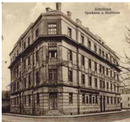
Nová radnice a spořitelna – Hauptstrasse 386 a 387 (Závodu míru) Dnes PČR

Nejvýznamnější stavbou je bezesporu kostel Nanebevstoupení Páně, postavený zásluhou mnoha lidí a sbírkami korunu po koruně. Mít svůj kostel byla pro obec čest. Kostel byl slavnostně vysvěcen 10. října 1909 kardinálem Lvem Skrbenským. Druhou významnou stavbou je nová radnice, kterou tvoří dvojdom č. 386 a 387 (dnes Závodu míru). Stavba se prováděla na místě strženého domu č. 8. Po velkých obtížích byla dokončena během roku 1924. Obecní kanceláře byly do nové budovy přestěhovány 6. 1. 1925. V roce 1928 koupila místní spořitelna polovinu objektu. Třetí z významných staveb je zámek, který na místě zvaném am Leckplatz (dnes Závodu míru č. 88) nechal roku 1862 vybudovat Emanuel Nowotny. Provedením se dům zřetelně odlišoval od tehdejších staveb, což také vysvětluje jeho pojmenování. Zámek je v současné době domov důchodců.