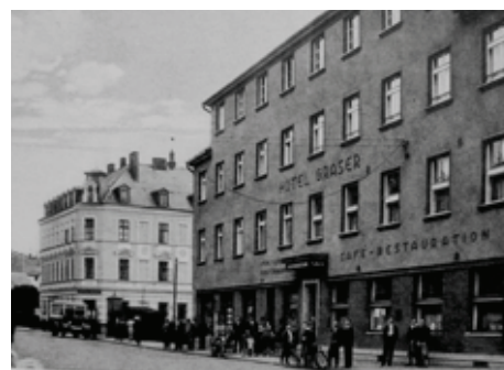
Zleva hotel Siegl č. 1, hotel Graser č. 77 – Hauptstrasse (Závodu míru)