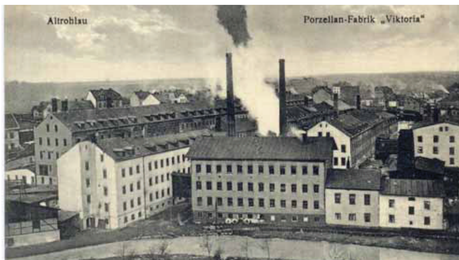
Porcelánka Viktoria v roce 1926