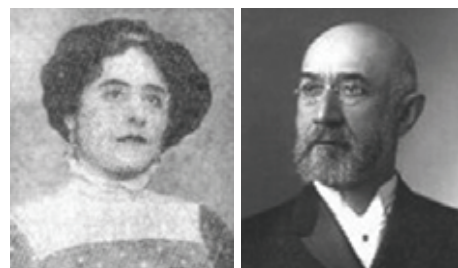
Rosalie Ida Straus (63) a Isidor Straus (67), oběti z Titaniku