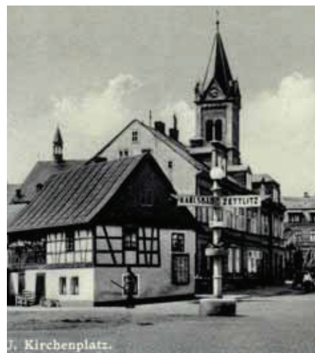
Kirchenplatz (Závodu míru). V popředí hrázděný dům ban untern Hanerich