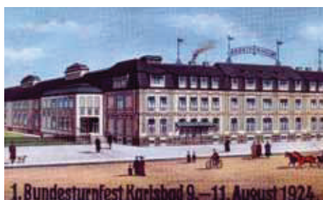
Arbeiterheim – Schulgasse 358 (Školní)

Po zprůměrnění Staré Role přibýlo obyvatel, a tak již v roce 1840, kdy žilo v obci 110 školou povinných dětí, uvažovali o stavbě vlastní školy. V roce 1854 byla zřízena nejprve putovní škola (Wanderschule). V tu dobu nebyla k dispozici žádná vlastní školní budova, a tak vyučování probíhalo střídavě v různých selských jizbách a příslušný majitel poskytl učitelé také stravu. Nová školní budova byla postavena v roce 1857 (dnešní Vančurova ulice). Dostala domovní č. 30 po zbouraném starém hostinci (ban Keckn), který stál v dnešní Javorové ulici na místě domu 361. Za nějaký čas první školní budova nestačila, a tak se přistavěla přední jednopatrová část. Dalším pokračováním bylo rozšíření objektu na východní stranu a později přístavba k západní straně a zvýšení celé budovy (dnes Vančurova 83). V roce 1883 byl položen základní kámen k výstavbě měšťanské školy (Školní 310).