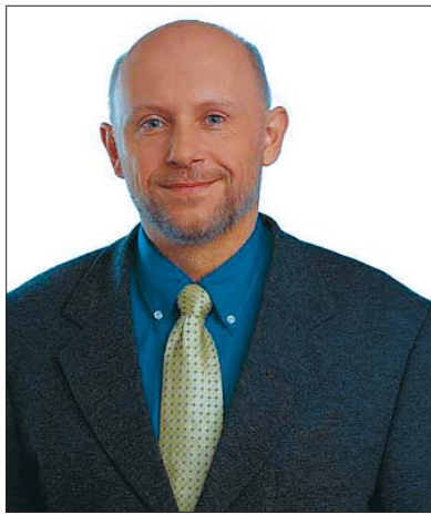
Ing. Miloš Patera, poslanec Poslanecké sněmovny Parlamentu České republiky za Karlovarský kraj. Do PS PČR byl zvolen v létě roku 2002.

Můžete nám sdělit, jaké jsou vaše dojmy po téměř dvou letech práce ve Sněmovně?