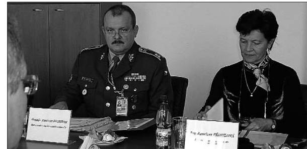
Náměstkyně ministra obrany informovala hejtmána o dopadech zeštíhlení armády