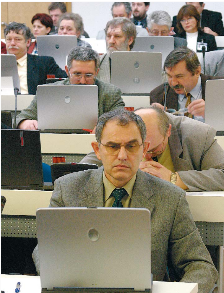
Zastupitelé od listopadu pracují s dokumentací v elektronické podobě. Aby mohli na jednání zastupitelstva používat počítače, musely být rozšířeny pracovní desky jejich lavic.

Kraj chce letos také zahájit výstavbu krajské knihovny, na kterou v první fázi uvolní 25 milionů korun. Stejně prostředky chce použít na investiční akce v oblasti školství. Deset milionů má kraj v rozpočtu v rámci modernizace záchranné služby na nákup nových sanitek. Přes 30 milionů si vyžádají plánované investice ve zdravotnictví.