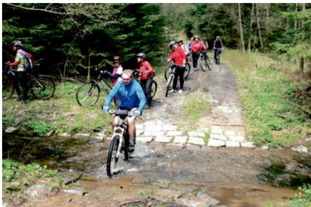
Někteří si brod přes Hadovku užívají, jiní se mu raději vyhnu.

Z Konstantinových Lázní se vydáme od nádraží u trasy 2206 směrem na Planou u Mariánských Lázní. Trasa vede po asfaltové cestě podél železniční tratě a zastávky Kokašice. Toto nádraží bylo původně výstupním místem pro hosty Konstantinových Lázní, kteří pak z nádraží odjížděli bryčkami do lázeňských penzionů.