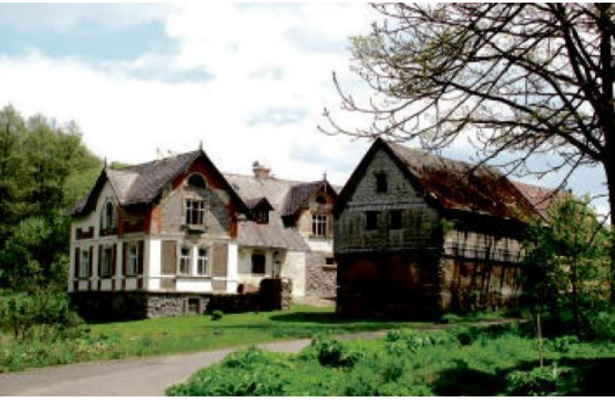
Z Výskovic zbyl jen tento statek.