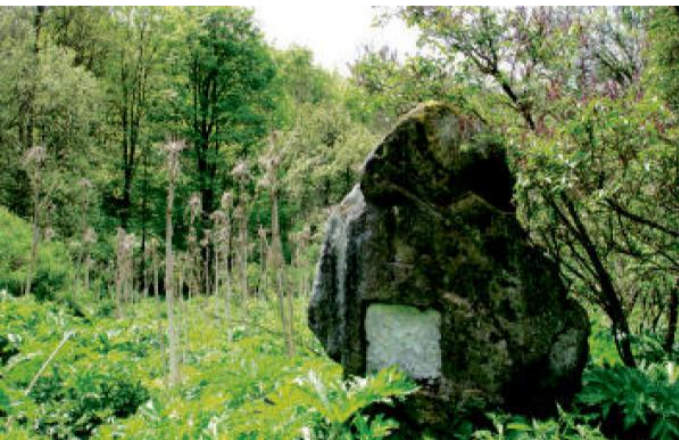
Bývalý Goethův pomník ve Výskovicích.