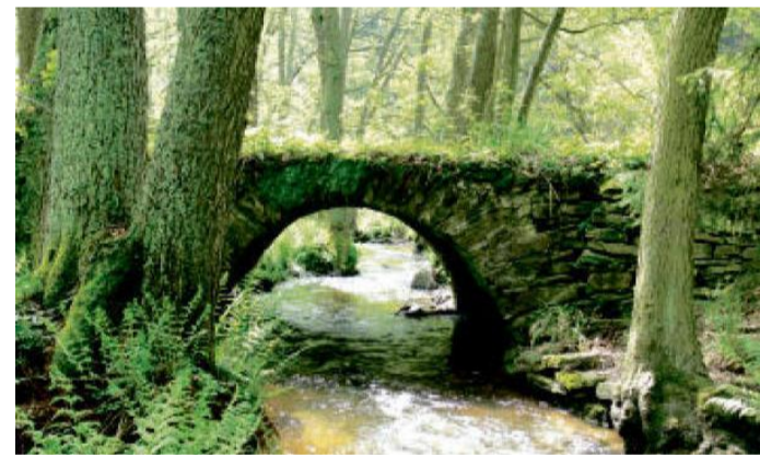
Starý klenutý mostek přes Hadovku.

de rychlý sjezd k samotě Buchtal a Kosím potok. Silnice s trasou 2138 nás dovede do Dolního Kramolína, kde stojí za povšimnutí kamenný most přes potok. Pak již zbývají jen závěrečné čtyři kilometry okolo rybníka Regent do cíle dnešního výletu v Chodové Planě.