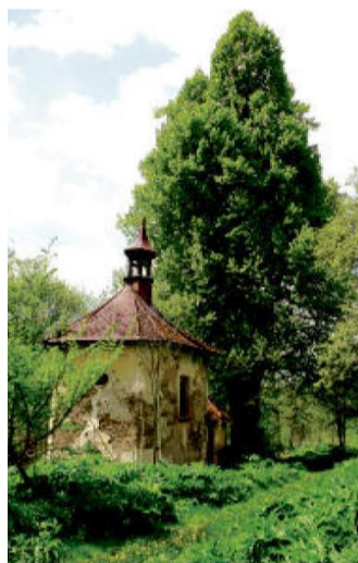
Zapomenutá kaple ve Výskovicích.

Trasy 2216 se budeme držet až do Hanova. Zástavbu Hanova tvoří statky se štíty obrácenými do návsi. Jejich dvory jsou přístupné branami a brankami. I tady došlo po