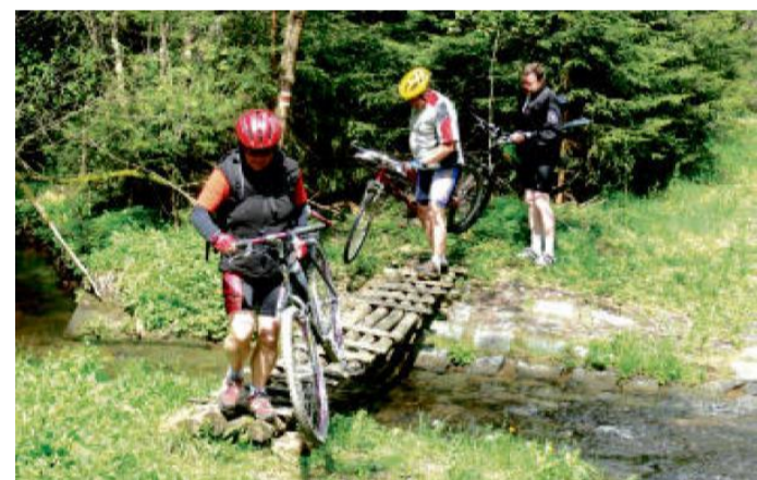
Kdo nechce brodit Hadovkou, může kolo převést po lávce.

Vlakem – výchozí železniční stanice jsou Konstantinovy Lázně, cílovou Chodová Planá (pouze osobní vlaky). Nejbližší rychlíková stanice je Planá u Mariánských Lázní (4 km) Autem – výchozím místem jsou Konstantinovy Lázně, parkoviště u nádraží má dostatek parkovacích míst, k návratu je možné použít vlak.