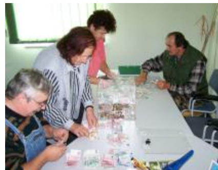
Otevření pokladničky veřejné sbírky